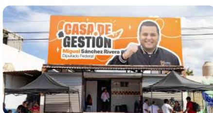
Casa Enlace y eventos comunitarios