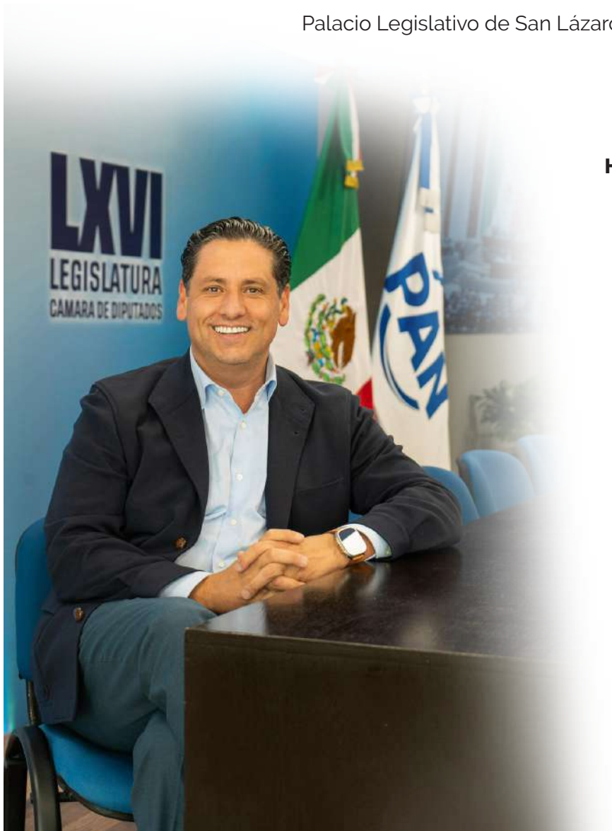
Homero Niño de Rivera

Palacio Legislativo de San Lázaro, 31 de agosto de 2025.