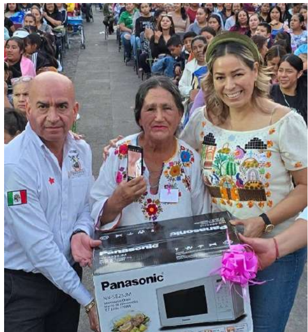
Conviví con las mamás de Tzintzuntzan mujeres trabajadoras que dejan día a día su mejor esfuerzo para sacar a su familia adelante.