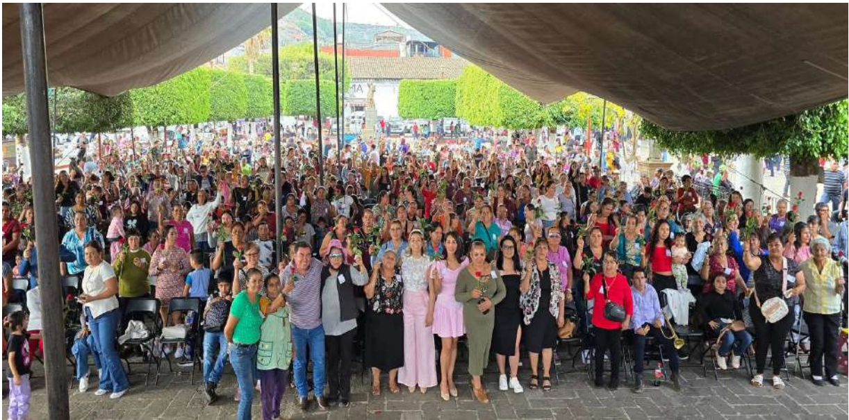
Con el presidente municipal de Tacámbaro realizamos el festejo del día de las madres.