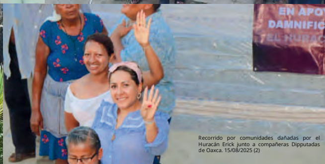
Recorrido por comunidades dañadas por el Huracán Erick junto a compañeras Diputadas de Oaxca. 15/08/2025 (2)