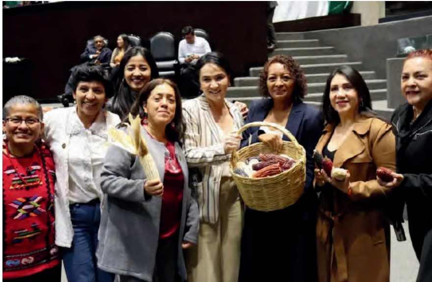
Sesión Ordinaria :25/05/2025

En la presentación de mi reserva al dictamen con proyecto de decreto por el que se expide la Ley General del Sistema Nacional de Seguridad Pública , hice uso de la palabra en representación de la bancada de Morena, fijando mi postura en sentido positivo. Esto, porque el dictamen tiene como finalidad construir una estrategia de largo plazo, con una visión sistémica y atención a las causas, considerando la inteligencia como un instrumento fundamental para prevenir y combatir amenazas, y con ello garantizar la seguridad pública.