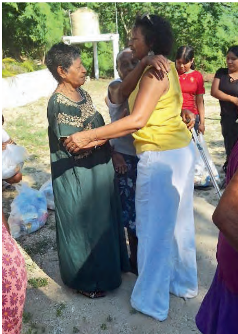
Entrega de despensas a damnificados por Huracán Erick, en Zimatán, Santiago Astata, Oaxaca. 04/08/2025

Después de un proceso electoral con una amplia participación ciudadana, cuya histórica mayoría obtenida por la coalición Sigamos Haciendo Historia otorga plena legitimidad a los cargos de representación popular, asumo con orgullo la responsabilidad de Diputada Federal. Este cargo lo alcanzamos gracias a la acción afirmativa afromexicana y, sobre todo, a la confianza que el Pueblo de México expresó en las urnas el pasado 2 de junio de 2024.