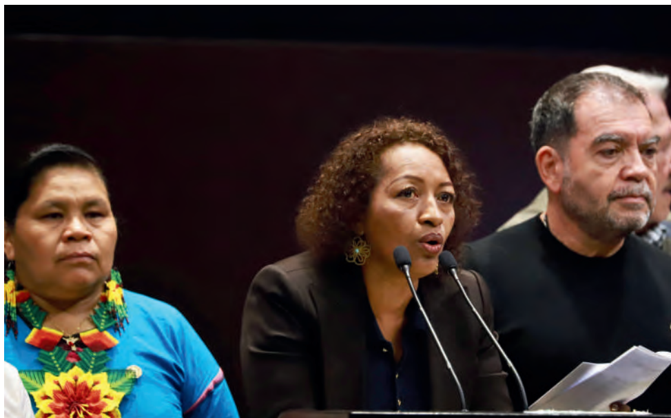
Uso de la tribuna 26/03/2025

contra de la discriminación racial , acto que sigue siendo parte de nuestras vidas, y por el cual seguimos en la lucha, para hacer frente y erradicar este acto intolerable que es la discriminación racial.