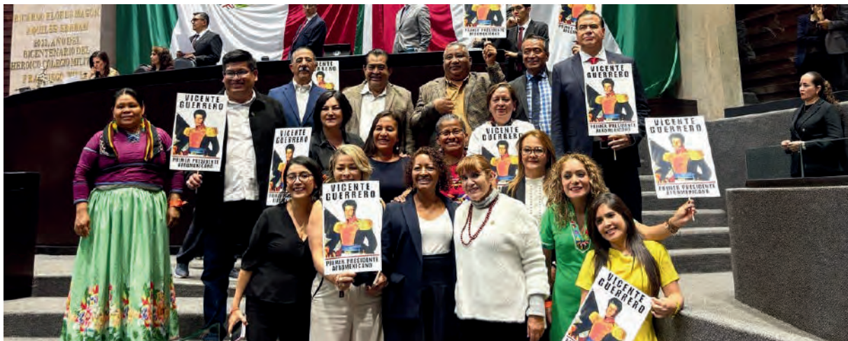
Uso de la tribuna 25/02/2025