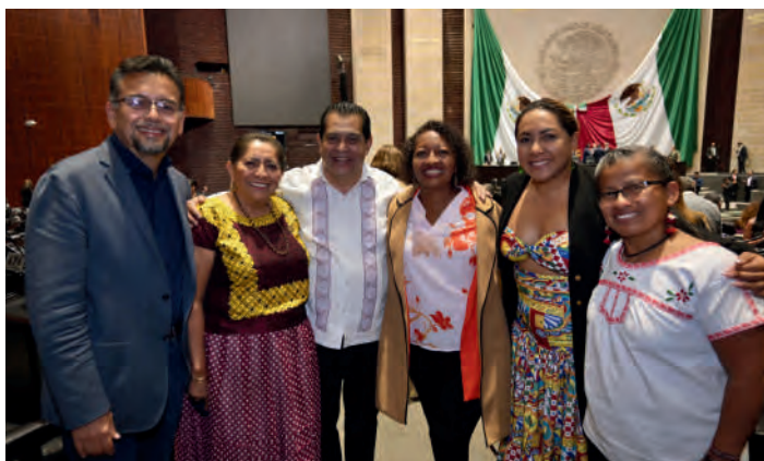
Sesión ordinaria: 27/02/2025

En la presente LXVI Legislatura de la Honorable Cámara de Diputados, tengo el honor de ser la Presidenta de la Coordinación Temática Afromexicana, la cuál se encarga del seguimiento al tema de la Legislación en materia.