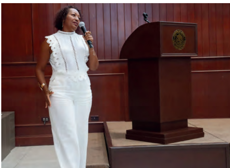
Evento: Voces de Ébano y Resistencia. Culiacán, Sinaloa. 18/07/2025

En este encuentro, hermanas Afromexicanas realizamos un intercambio en cuanto a los avances que se ha tenido, y con los que se ha hecho justicia hacía nosotras tras años de lucha por nuestro reconocimiento, así como visibilizar a las mujeres afromexicanas en estados donde hay una invisibilización que todavía las somete a desventajas y desigualdades.