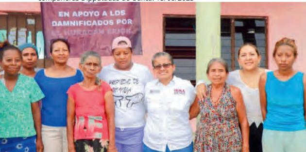
Recorrido por comunidades afectadas por el Huracán Erick junto a compañeras Diputadas de Oaxca. 15/08/2025