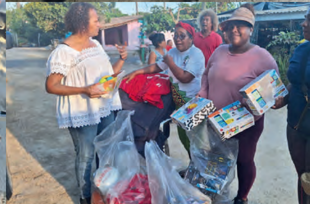
Entrega juguetes, cobertores y ropa deportiva en Corralero, Oax.: 08/04/2025