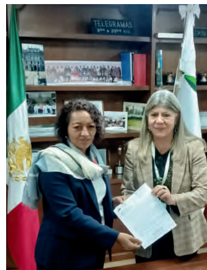
Reunión en las instalaciones de FINABIEN. 10/10/2024

Sostuve una grata reunión con la Directora General de Financiera para el Bienestar, Mtra. María del Rocío Mejía , en la que le solicité los apoyos para las mujeres Afromexicanas e Indígenas de la costa de Oaxaca, afectadas en su economía por los desastres naturales.