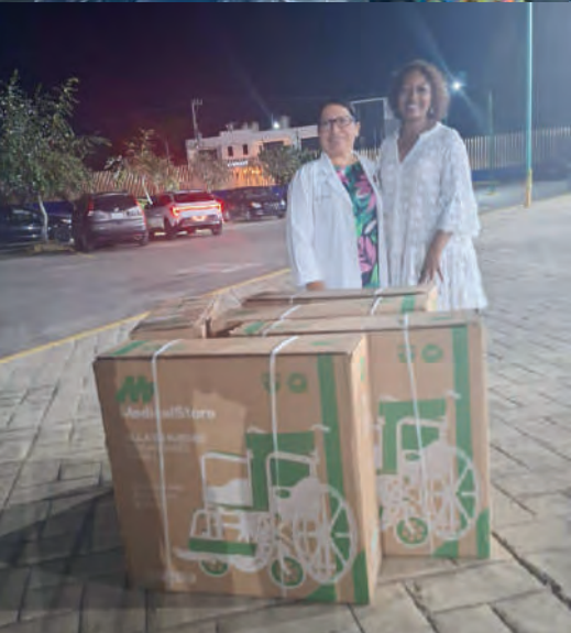
Entrega de apoyo de 5 sillas de ruedas en el Hospital de Especialidades de la Ciudad de Oaxaca de Juárez: 24/05/2025