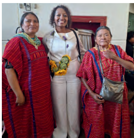
Foro: "Mujeres Afromexicanas e Indígenas, Ensenada Baja California. 03/08/2025

En este foro vivimos una jornada de reflexión en donde estuvimos voces de mujeres Afromexicanas e Indígenas que mantenemos el compromiso firme en la lucha por la justicia social. Destacamos la participación de las ponentes ya que mantuvieron presentes las memorias de nuestras ancestras que han sembrado su semilla como inspiración en las nuevas generaciones, fortaleciendo el reconocimiento de nuestras raíces.