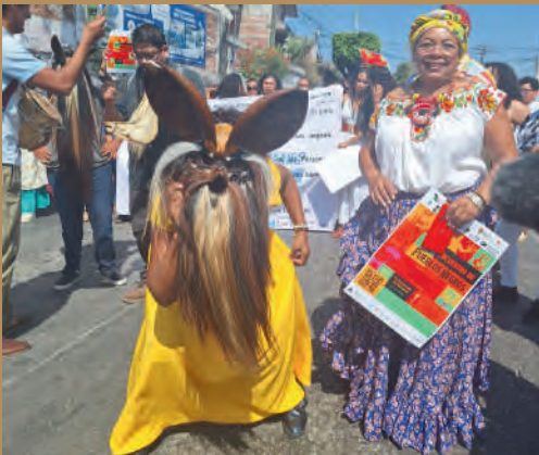
XXV Encuentro de Pueblos Negros:19/11/2024

EL 04 de octubre, participé como ponente en el XXVIII Festival Internacional Afrocaribeño 2024 en el Centro Cultural Exconvento Betlehemita, Veracruz , en el cual fui condecorada con la Medalla "Gonzalo Aguirre Beltrán" como reconocimiento a mi labor en la lucha y la defensa de los derechos de las mujeres y de las personas Afromexicanas.