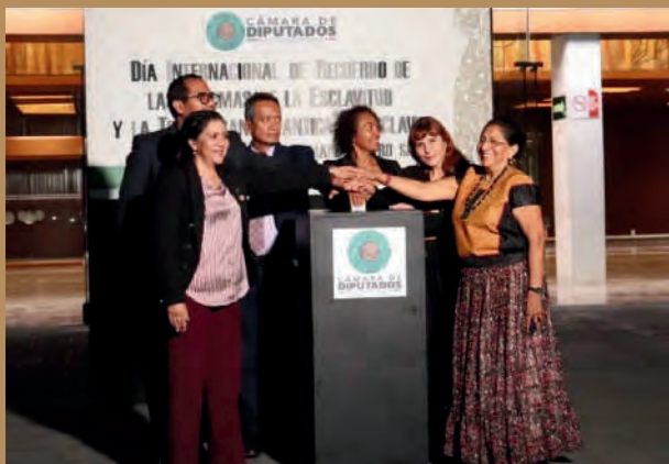
Iluminación del Frontispicio de la Honorable Cámara de Diputados. 01/04/2025

Iluminación del frontispicio de la Cámara de Diputados, en conmemoración del Día Internacional del Recuerdo de las Víctimas de la Esclavitud y la trata Transatlántica