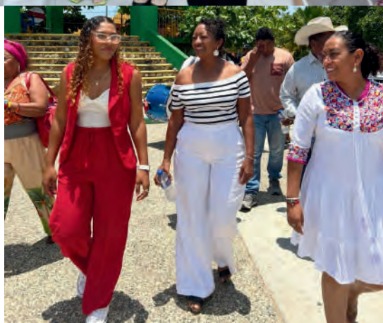
Taller de Identidad y auto adscripción Afromexicana. San Nicolás Gro. 07/08/2025