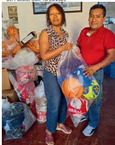
Entrega de material deportivo para escuelas primarias en Santa María Huatulco y San Miguel del Pueblo, Oax. 18/03/2025