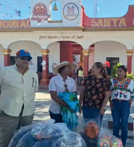
Entrega de juguetes, cobertores y playeras para apersonas adultas mayores en Santa Catarina Mechoacán, Oax.: 09/04/2025