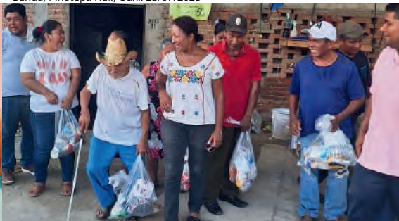
Entrega de despensas a damnificados por Huracán Erick, en Barrio La Banda, Pinotepa Nal., Oax.. 23/07/2025