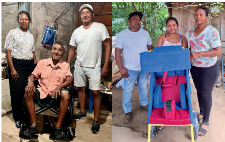
Entrega de silla de ruedas para un adulto mayor, en Villa de Tututepec, Oax. 06/07/2025