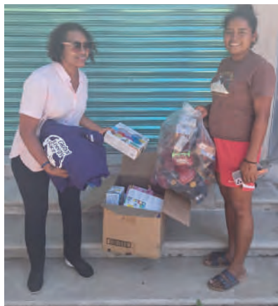
Charquito, Jamiltepec, Oaxaca. 13/04/2025