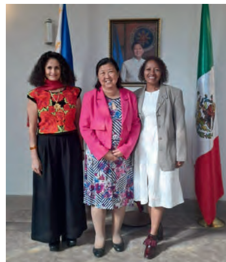
Reunión en la embajada. 21/07/2025

Con esta última, hemos planteado el intercambio de ideas y de experiencias al reunirnos con pescadores, y agricultores de cocoteros, para favorecer su producción y retroalimentarnos con los programas y los avances que existen en el país de Filipinas dentro del ámbito de la acuicultura y de la agricultura.