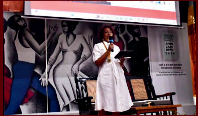
XXVIII Festival Internacional Afrocaribeño 2024. 04/10/2024

EL 04 de octubre, participé como ponente en el XXVIII Festival Internacional Afrocaribeño 2024 en el Centro Cultural Exconvento Betlehemita, Veracruz , en el cual fui condecorada con la Medalla "Gonzalo Aguirre Beltrán" como reconocimiento a mi labor en la lucha y la defensa de los derechos de las mujeres y de las personas Afromexicanas.