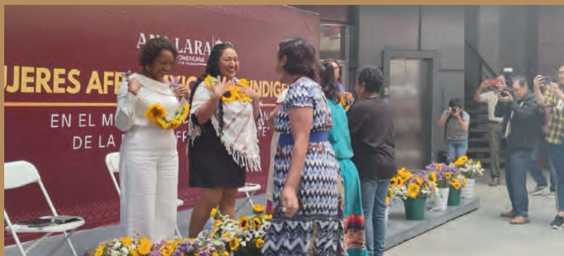
Foro: "Mujeres Afromexicanas e Indígenas, Ensenada Baja California. 03/08/2025