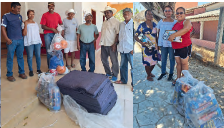
El Ciruelo, Pinotepa Nacional, Oaxaca. 12/04/2025