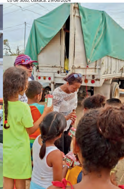
Entrega de cobertores, víveres y colchonetas a damnificados por Huracán Erick en San Juan Bautista Lo de Soto, Oaxaca. 29/06/2024

Desde mi corazón, reconozco y agradezco todos los apoyos de quienes se han sumado a mi trabajo legislativo y de gestión, en beneficio de los pueblos y comunidades Afromexicanas, gracias por siempre.