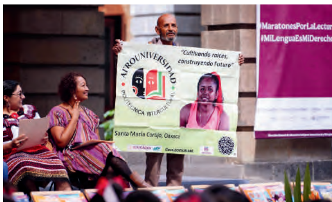
Día Internacional de la Lengua Materna. 21/02/2025

En este acto conmemorativo, reflexionamos sobre la gran importancia que se tiene en la protección de lenguas indígenas y de la promoción de las mismas, con ello, destacamos su conmemoración, ya que, se encuentran en riesgo de desaparecer debido a la globalización que ha surgido a través de los años. Con el honor de haber tenido el uso de la palabra, enfatice la urgencia de que se lleven a cabo medidas de protección para salvaguardar el patrimonio lingüístico que representan y el cual refleja nuestra riqueza histórica y cultural de los pueblos Indígenas y Afromexicanos.