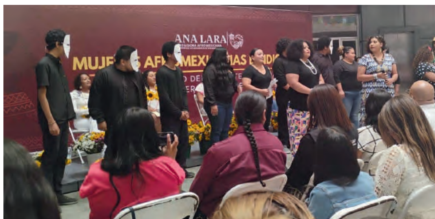
Foro: "Mujeres Afromexicanas e Indígenas, Ensenada Baja California. 03/08/2025