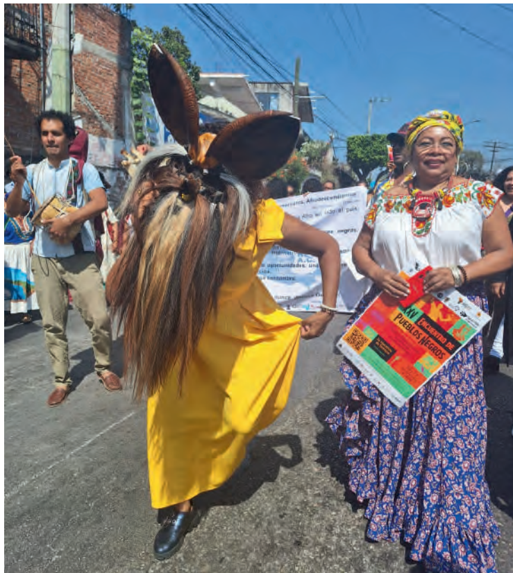
XXV Encuentro de Pueblos Negros:19/11/2024

Soy orgullosamente negra y represento a la población afromexicana. A lo largo de los años hemos sido históricamente invisibilizados; sin embargo, a partir de 2019 fuimos reconocidos constitucionalmente, lo que nos ha permitido contar con derechos que garantizan nuestra participación política y nuestra representación en los procesos electorales.