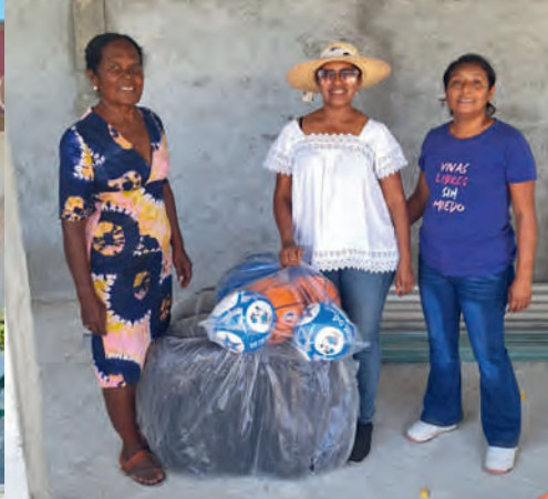
Entrega de cobertores y artículos deportivos en El Ciruelo, Oax.: 08/04/2025