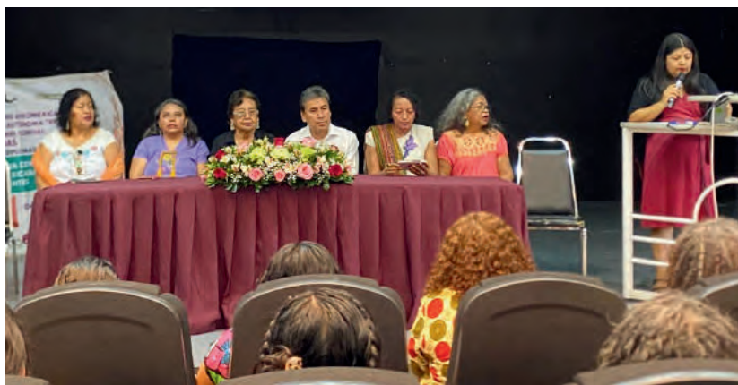
Clausura del Diplomado de la Tercera Generación. 20/09/2024