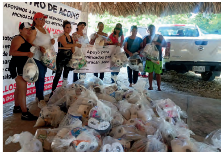
Entrega de víveres. . 13/10/2024

Municipio de Santo Domingo Armenta Comunidades (2): • Callejón de Rómulo • Lagunillas