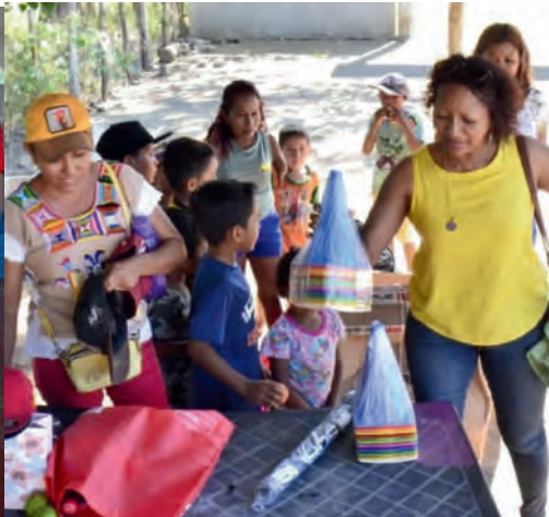
Entrega de material deportivo para niñas y niños de la comunidad de Santiago Pinotepa Nacional. Oax. 08/12/2024