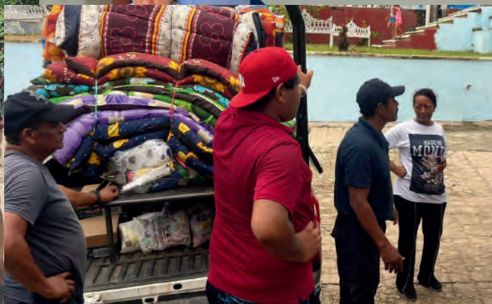
Recorrido por comunidades dañadas por el Huracán Erick junto a compañeras Diputadas de Oaxca. 15/08/2025 (2)