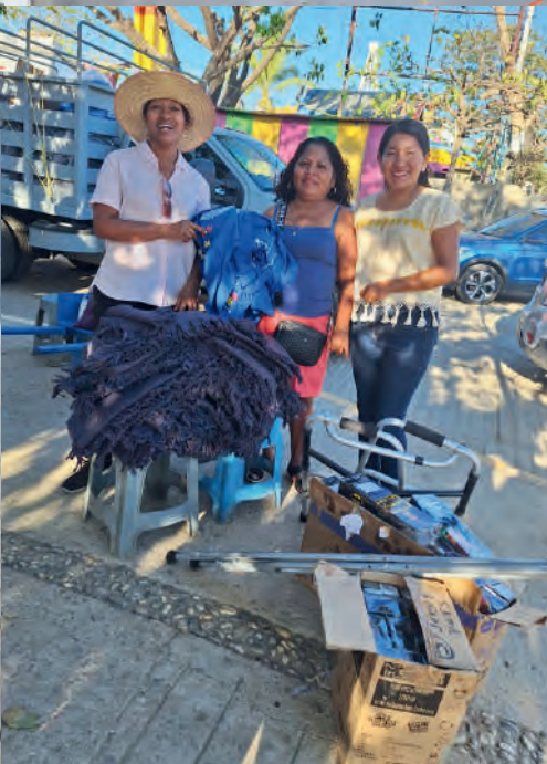
Entrega de juguetes, cobertores, andaderas y bastones en San Andrés Huaxpaltepec, Oax. 09/04/2025