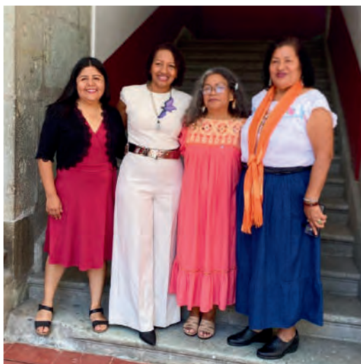
Clausura del Diplomado de la Tercera Generación. 20/09/2024

Teniendo como sede la Facultad de Bellas Artes de la Universidad Autónoma, Benito Juárez de Oaxaca, nos reunimos mujeres Afrodescendientes de México y América Latina en donde celebramos el último módulo y la clausura del Diplomado Internacional realizado por la Cátedra Itinerante de Mujeres Afromexicanas y Afrodescendientes (CIMAA), espacio donde compartieron momentos de reflexión, luchas antirracistas y afrofeministas, avances y desafíos, además de experiencias que nos han marcado nuestras vidas.