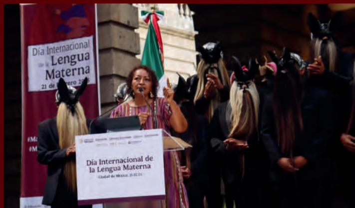
Día Internacional de la Lengua Materna. 21/02/2025

Como Secretaria de la Comisión de Pueblos Indígenas y Afromexicanos, participé en el evento organizado por la Secretaría de Educación Pública (SEP) con motivo del Día Internacional de la Lengua Materna .