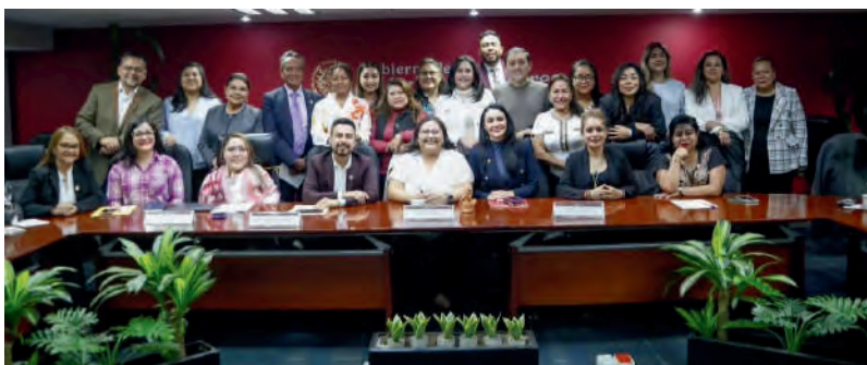
Reunión con la Secretaría de la Mujer. 12/02/2025

Diputadas y Diputados de morena, sostuvimos una reunión con la titular de la Secretaría de las Mujeres, Citlalli Hernández Mora , en donde reafirmamos nuestro compromiso de legislar con igualdad y justicia social a favor de las mujeres. Como Diputada Federal Afromexicana, puse sobre la mesa la agenda de las mujeres Afromexicanas que requieren de políticas públicas con perspectiva de género y de inclusión, principalmente para acortar la brecha de desigualdad en la que viven.