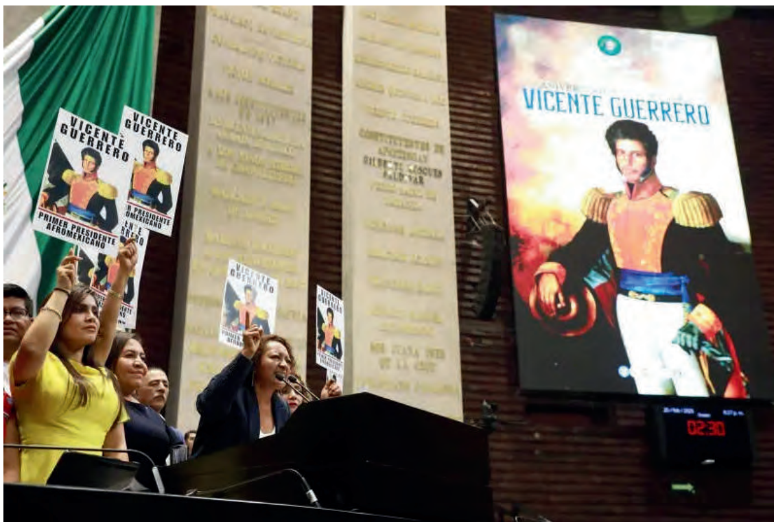
Uso de la tribuna 25/02/2025

En el marco conmemorativo del aniversario luctuoso de Vicente Guerrero, primer presidente Afromexicano de la República , hice uso de la palabra para fijar el posicionamiento en representación del Grupo Parlamentario de morena , como la única Diputada Federal Afromexicana por acción afirmativa.