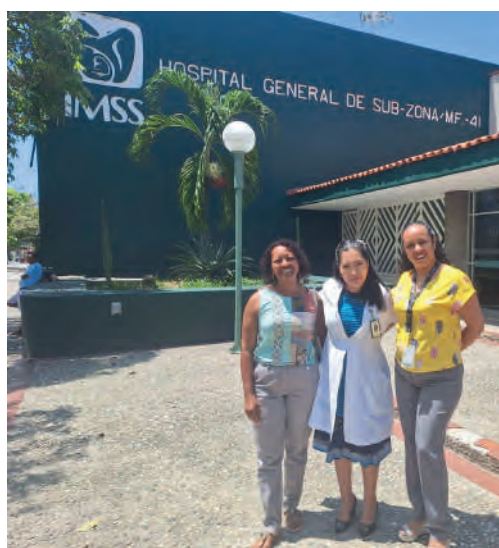
Reunión con Directora del IMSS en Santa Cruz Huatulco, Oax. 10/06/2025