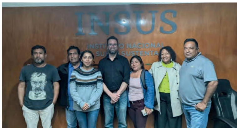
Reunión con el Director General de INSUS. 18/06/2025