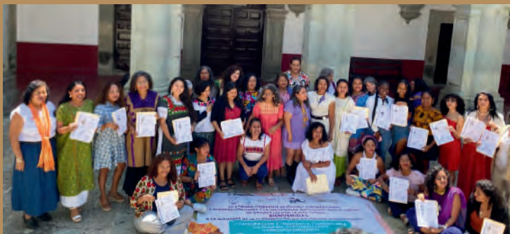
Clausura del Diplomado de la Tercera Generación. 20/09/2024

Clausura de la tercera generación del Diplomado internacional “Participación e incidencia comunitaria de mujeres afromexicanas y afrodescendientes”.