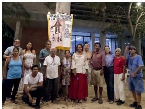
Reunión con la Cooperativa del Monte y el Consejo Histórico . 18/03/2025