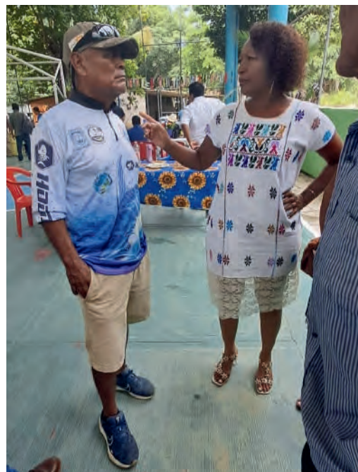
Visita al mercado gastronómico en san José Cuajinicuil. 27/07/2025

Impulso, desde julio del presente año a la fecha, el Proyecto de turismo comunitario, ofreciendo diversos productos al turismo, entre ellos el mercado gastronómico, en la comunidad de San José Cuajinicuil, Santa María Huatulco, Oax.