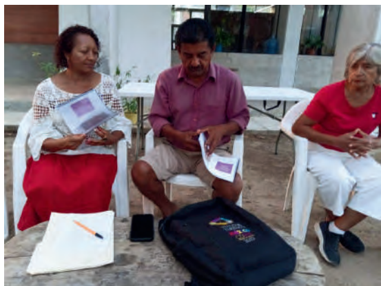
Reunión con la Cooperativa del Monte y el Consejo Histórico . 18/03/2025

En coordinación con la Cooperativa Cruz del Monte y el Consejo Histórico de Santa María Huatulco , llevamos a cabo una reunión para discutir diversos proyectos comunitarios para impulsar la cultura local. Durante este encuentro, visitamos la primera escuela primaria que, conforme a lo planeado, se espera sea la primer escuela trilingüe con el estudio del español, inglés y zapoteco.