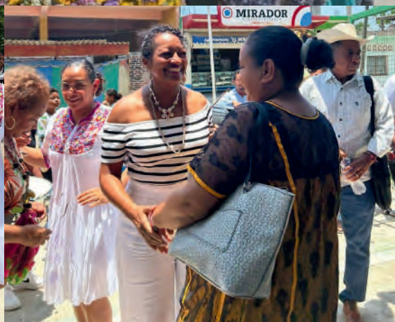
Taller de Identidad y auto adscripción Afromexicana. San Nicolás Gro. 07/08/2025