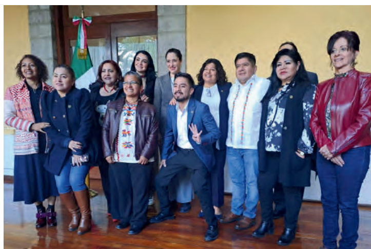
Reunión con la Directora de Cultura. 21/02/2025

Diputadas y Diputados de morena, nos reunimos con la Titular de la Secretaría Cultura, Lic. Claudia Curiel de Icaza , con el fin de analizar temas para la agenda legislativa, en la misma expuse la necesidad de impulsar las artes en las comunidades afromexicanas de Oaxaca y la promoción de las artesanías elaboradas por mujeres afromexicanas para reactivar la economía familiar.