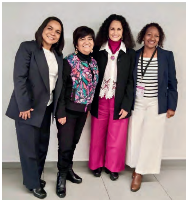
Reunión con la Titular de SEDATU. 27/06/2025