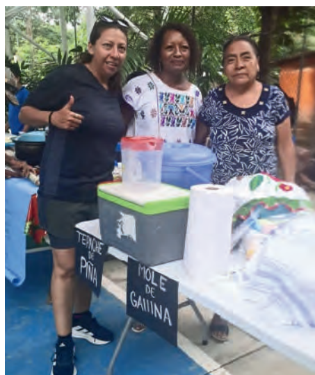
Visita al mercado gastronómico en san José Cuajinicuil. 27/07/2025

El esfuerzo de nuestras cocineras Afromexicanas e indígenas merece su reconocimiento, es por ello que contribuí para la realización de la Feria y exposición del Maíz y el mercado gastronómico en la comunidad indígena Zapoteca de San José Cuajinicuil, en Santa María Huatulco, Oax. donde disfrutamos de más de 30 platillos tradicionales.