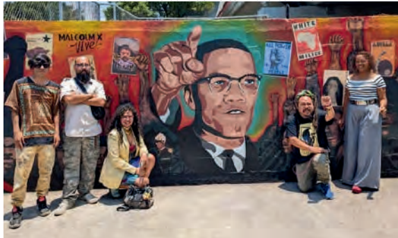
Mural conmemorativo de Malcom X. 19/05/2025