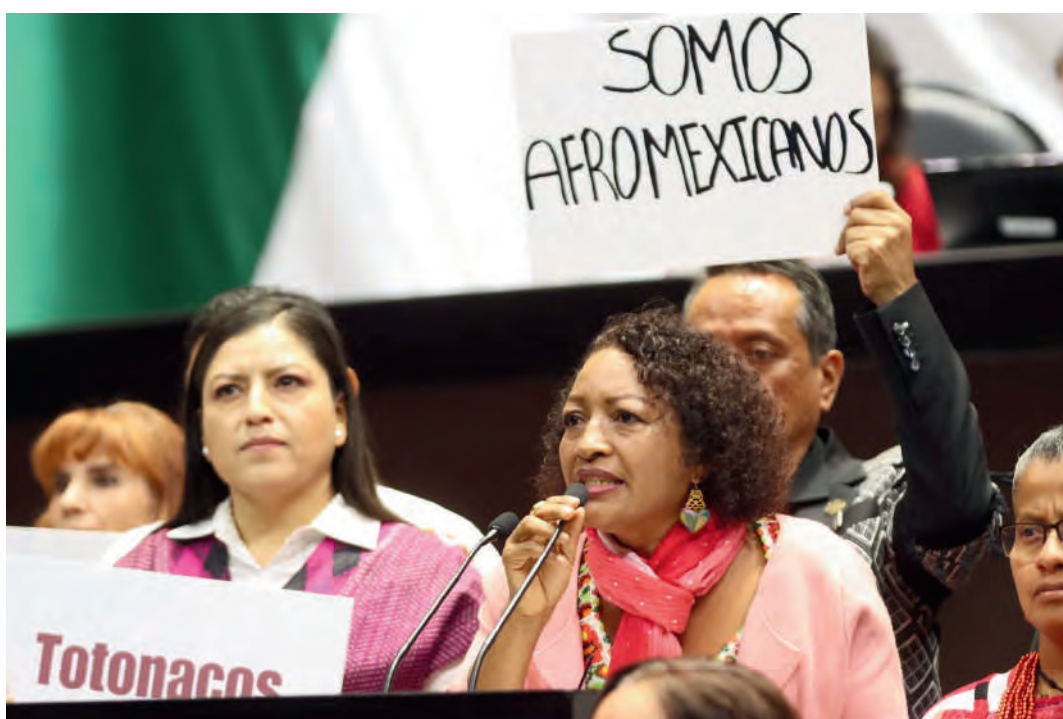
Uso de la tribuna 18/09/2024

Durante mi trabajo en la Honorable Cámara de Diputados, he tenido el honor, en diversas ocasiones, de poder hacer uso de la palabra desde la más alta tribuna, interviniendo en efemérides celebradas a nivel nacional, presentando reservas, fijando mi postura y respaldando las reformas presentadas durante las sesiones en el pleno de la Cámara de Diputados.