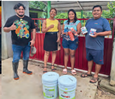
Donación de botes de pintura para el jardín de niños Leandro Valle, en la comunidad de Hacienda Vieja, Huatulco, Oax. 12/06/2025