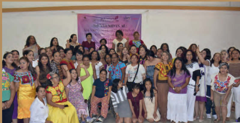
Foro Nacional de Mujeres. Santa María Huatulco, Oax. 15/03/2025