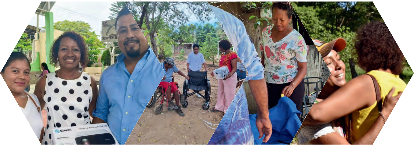
Entrega de apoyo de un proyector para la primaria "Vicente Guerrero" en la Comunidad de Santa María Limón, San Pedro Pochutla, Oax.: 14/07/2025