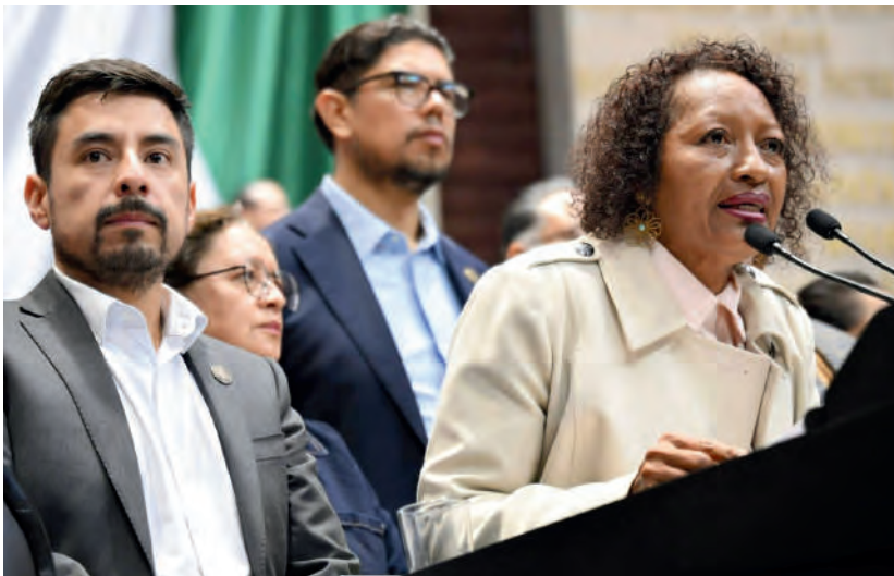
Uso de la tribuna 25/06/2025

En la presentación de mi reserva al dictamen con proyecto de decreto por el que se expide la Ley General del Sistema Nacional de Seguridad Pública , hice uso de la palabra en representación de la bancada de Morena, fijando mi postura en sentido positivo. Esto, porque el dictamen tiene como finalidad construir una estrategia de largo plazo, con una visión sistémica y atención a las causas, considerando la inteligencia como un instrumento fundamental para prevenir y combatir amenazas, y con ello garantizar la seguridad pública.