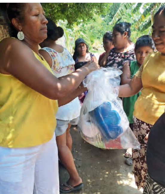
Entrega de despensas a damnificados por Huracán Erick, en Zimatán, Santiago Astata, Oaxaca. 04/08/2025

A la Senadora Susana Harp , por su inmediata donación de despensas, y por las gestiones que en coordinación con una servidora, logramos de la Alcaldía Iztapalapa.