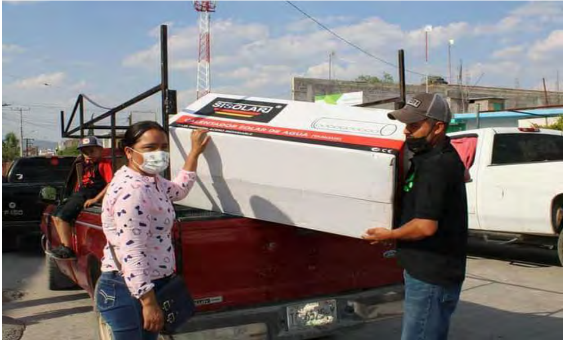
Mejoramiento de vivienda para beneficiar a familias del municipio de Xalisco.