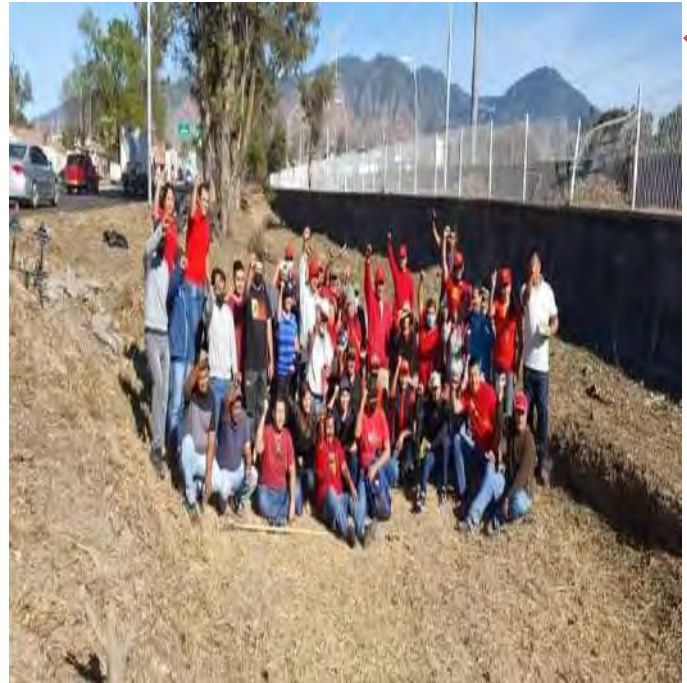
Parque Lineal de Tepic.