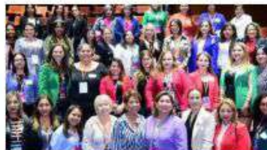
Fortalecimiento de las mujeres de Nuevo León hacia un liderazgo políticos