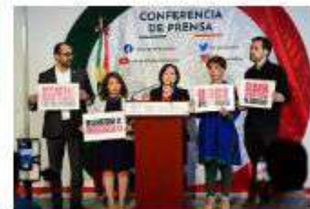
Declaratoria de Emergencia por sequía