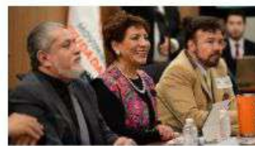
Recepción de magistrados de América Latina