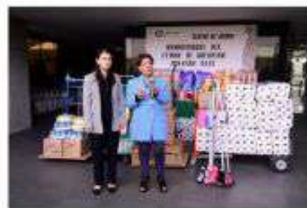
Entrega de viveres a damnificados por OTIS