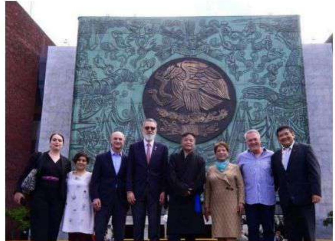
Recibimos a su excelencia del Tibet Sikyong Penpa Tsering en el Congreso de la Unión