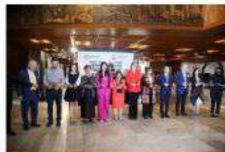
Inauguración de la exposición fotográfica Yuendumu por parte del Grupo de Amistad México-Australia