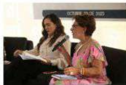
Presentación de libro: "Maternidades Feministas y Utopías Posibles"