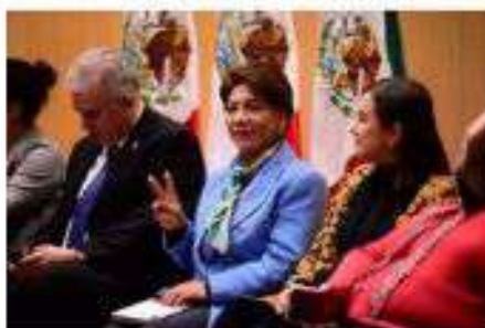
Evento: Juventudes México