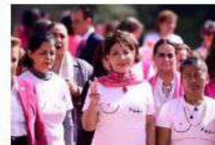
Día Mundial contra el Cáncer de Mama. El diagnóstico, tratamiento y medicamentos son fundamentales en la lucha contra la enfermedad.