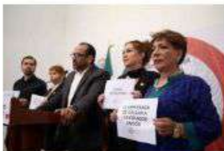
Presentación de Punto de Acuerdo para hacer frente a la crisis migratoria con perspectiva humanista que garantice los derechos humanos de la población migrante