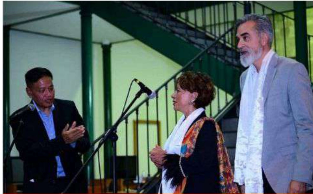
Llevamos a cabo el "Concierto Emsamble de Voz Amigos del Tibet" en la Bilblioteca de México