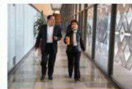
Representación en la Junta de Coordinación Política como Vicecoordinadora