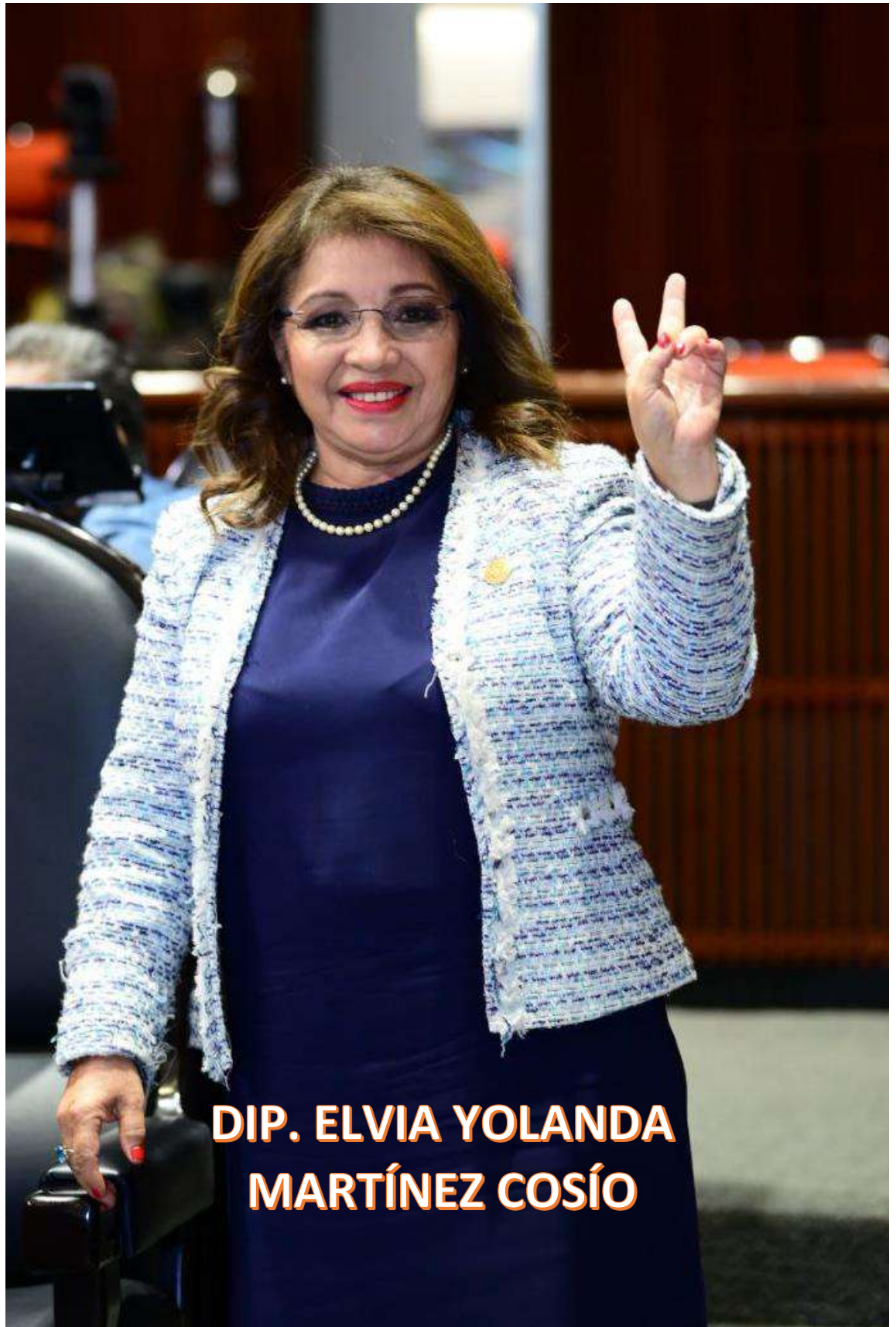
DIP. ELVIA YOLANDA MARTÍNEZ COSÍO