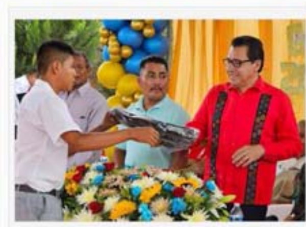
Esc. Sec. Gral. Gabriel García Marquez de la Comunidad de Ahuatepec Ejido de Tlapa de Comonfort, Gro