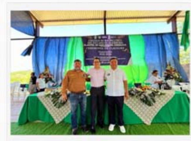
Colegio de Bachilleres de Axoxuca, Tlapa de Comonfort.