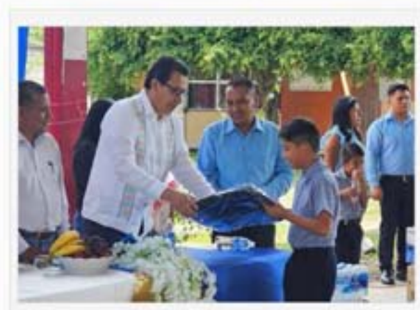
Esc. Prim. "Revolución T.V. " de la Comunidad de Tototepec del Municipio de Tlapa de Comonfort, Gro.