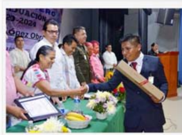
Carrera "Gestión Local y Gobierno Municipal" de la Universidad Intercultural del Estado de Guerrero. La Ciénega, Municipio de Malinaltepec, Gro.