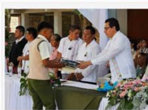
Esc. Sec. Gral. "Sor Juana Inés de la Cruz" Municipio de Tlapa de Comonfort, Gro.