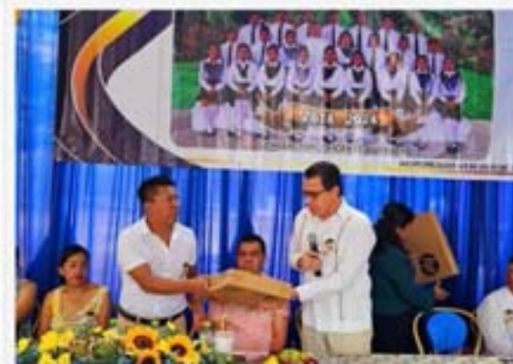
Escuela Primaria Rural Federal "Margarita Maza de Juárez". Tlapa de Comonfort