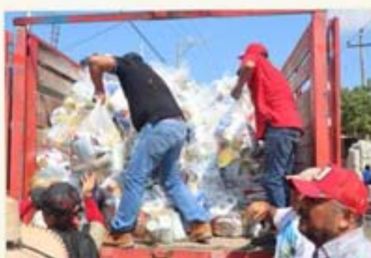
Apoyo con 6 toneladas de despensa a los Bienes Comunales y Colonias de Acapulco, en solidaridad por los estragos del Huracan Otis