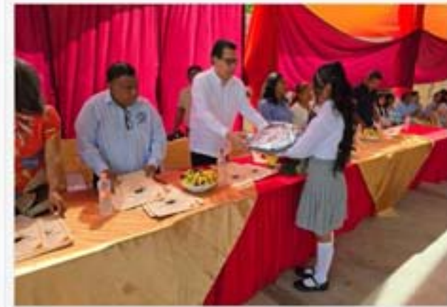
Escuela Secundaria General "Lázaro Cárdenas del Río", Tlapa de Comonfort.