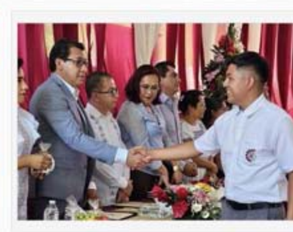
CBTis 178, del Municipio de Tlapa de Comonfort, Gro.