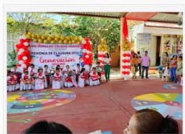
o Jardín de Niños "Luis Donaldo Colosio", Tlapa de Comonfort