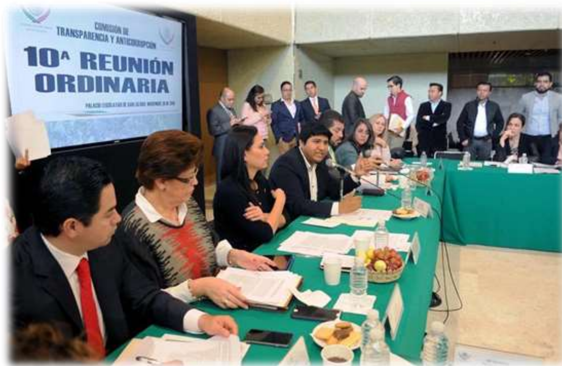
Tabla I. Asuntos aprobados en la Comisión