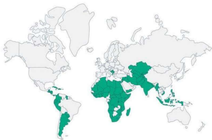
Mapa que ilustra los países objetivo de la Plataforma Mundial de Resiliencia Climática. 6

bilidad con procesos y participación de distintos actores para una implementación efectiva. La adaptación ha sido definida por el Grupo Intergubernamental de Expertos sobre el Cambio Climático (IPCC) como las iniciativas y medidas encaminadas a reducir la vulnerabilidad de los sistemas naturales y humanos ante los efectos reales o esperados de un cambio climático.