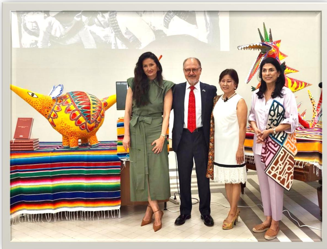
Junto con el Excmo. Sr. Carlos Isauro Félix Corona, Embajador de los Estados Unidos Mexicanos en la República de Serbia y su esposa en la celebración por los 80 años de Relaciones Diplomáticas entre México y Serbia

En este sentido, mi participación en este evento reafirma el compromiso de México con el fortalecimiento de sus relaciones internacionales , así como con la promoción de la diplomacia parlamentaria como herramienta para consolidar vínculos de cooperación y entendimiento entre los países.