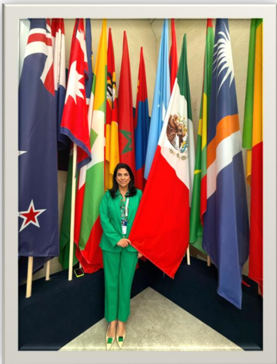
Representando a México en la Conferencia Mundial de Mujeres Parlamentarias de la Unión Interparlamentaria 2026.