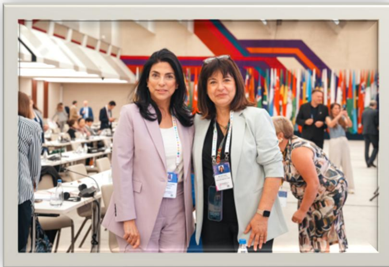
Junto con la Sra. Anda Filip, Secretaria General de la Unión Interparlamentaria, electa para el periodo del 1 de julio de 2026 al 30 de junio de 2030.