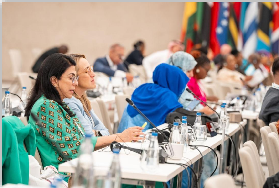
Participación en la Conferencia Mundial de Mujeres Parlamentarias de la Unión Interparlamentaria 2026

En este sentido, enfatizé que la paridad del siglo XXI será también digital, o no será , destacando la necesidad de garantizar que los avances logrados en el ámbito institucional se consoliden también en el entorno digital.