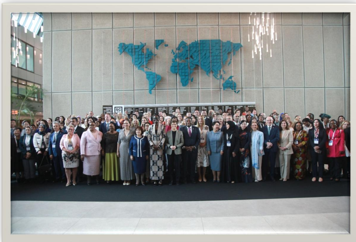
Mujeres Parlamentarias de más de 60 países.

En ese contexto, el presente informe tiene como objetivo presentar un resumen estructurado de las actividades, reuniones e intervenciones realizadas , destacando los principales temas abordados, los posicionamientos expresados y las contribuciones de México en el marco de la Conferencia Mundial de Mujeres Parlamentarias de la UIP 2026 .