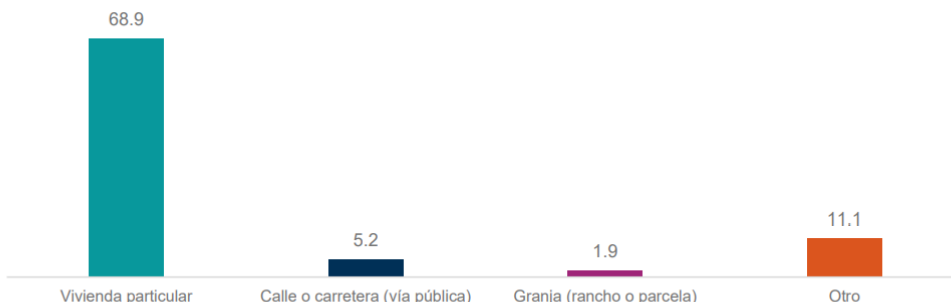
Gráfica 4 Suicidios por lugar de ocurrencia 2024 (distribución porcentual)