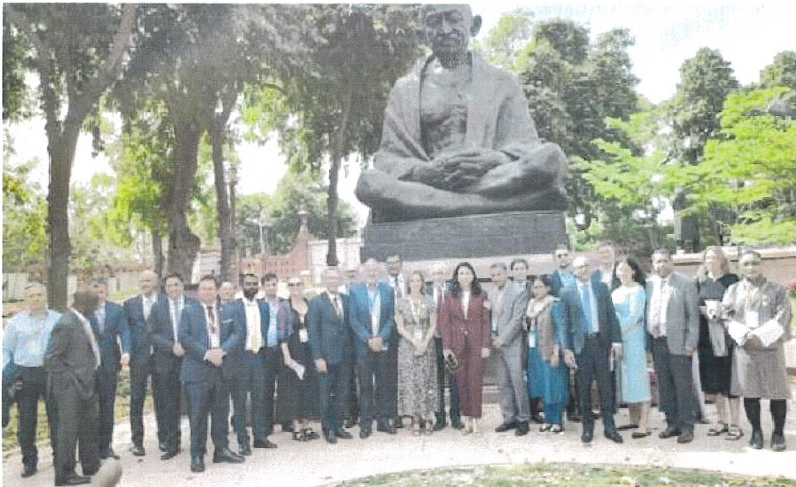
Junto con parlamentarios invitados al Foro NXT 2026