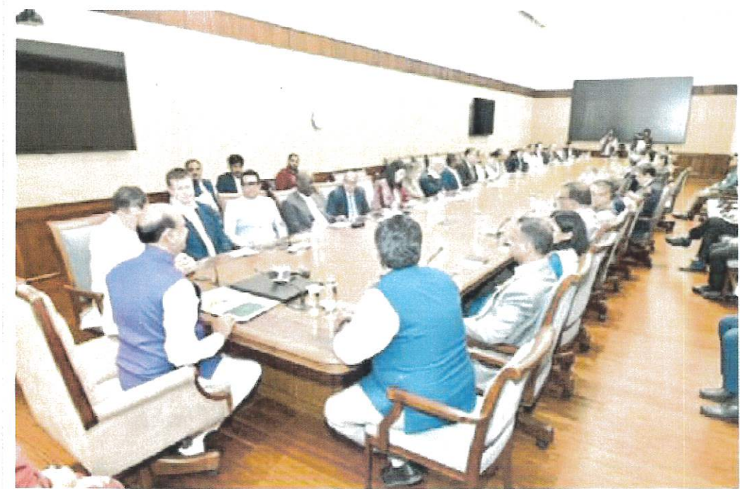
Reunión con Shri Om Birla, Presidente del Lok Sabha (Cámara Baja del Parlamento de la India)