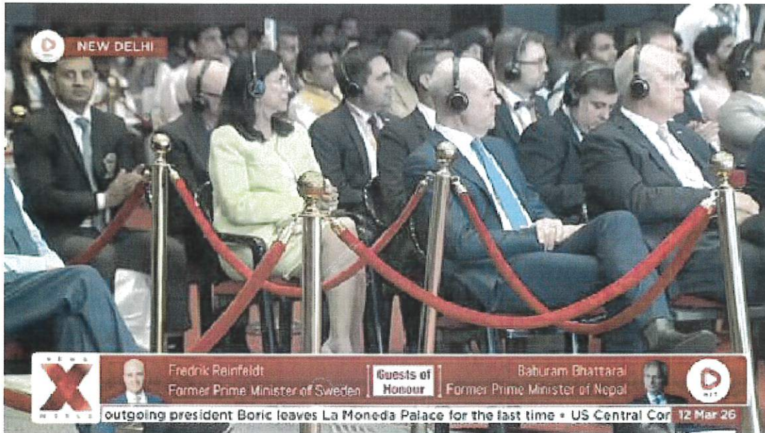
Primer día del Foro Internacional NXT 2026