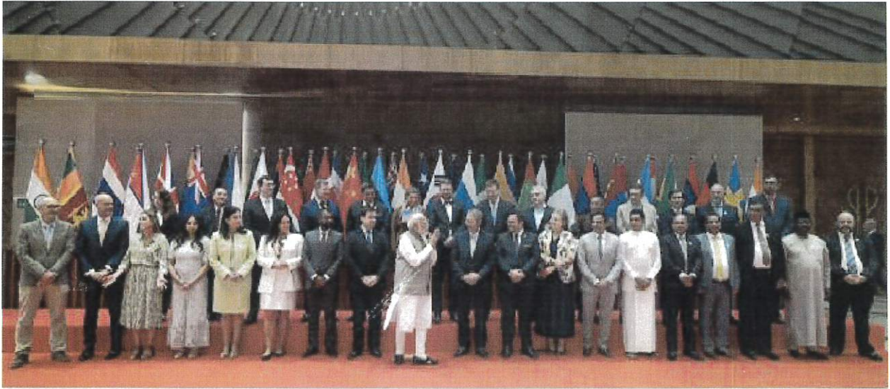
Fotografía oficial con el Primer Ministro de India, Shri Narendra Modi