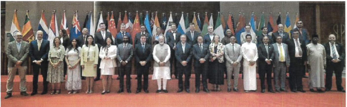
Parlamentarios de distintos países en la fotografía oficial con el Primer Ministro de India, Shri Narendra Modi

Asimismo, este tipo de espacios contribuyen a posicionar a México en escenarios internacionales estratégicos, promoviendo el intercambio de ideas y la construcción de alianzas en torno a los principales desafíos globales.