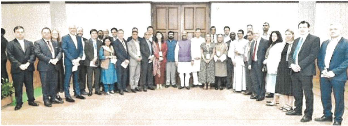
Parlamentarios de distintos países junto con Shri Om Birla, Presidente del Lok Sabha (Cámara Baja del Parlamento de la India)

Durante este encuentro, se intercambiaron puntos de vista sobre los retos globales actuales, el papel de los parlamentos en la gobernanza democrática y la importancia de fortalecer los vínculos entre México e India en el ámbito legislativo y diplomático.