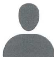
PENDIENTE - Republica Dominicana 2a Vicepresidencia