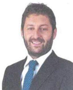
Dip. Juan Antonio Coloma - Chile 1a Vicepresidencia