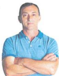
Dip. Carlos Reutor-Uruguay Presidencia