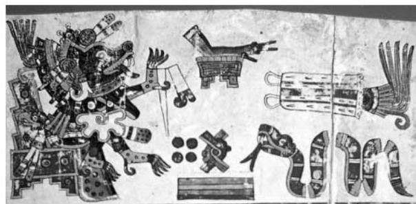
Figura 2. Códice Borgia, lámina 65 [fragmento]. Tomado de Pueblos Originarios. Escritura y Simbología 19

La importancia de los animales, sean salvajes, de compañía, de servicio, de labor o guías al Mictlán, radica por su rol en el medio ambiente pero también por su relación con las comunidades humanas, se estima que la humanidad y los perros tiene una relación de aproximadamente 12 mil años. 18