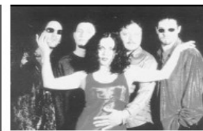
Santa Sabina. CDMX 1989

Sin embargo, aún con todos estos antecedentes y datos, no existe hoy declaratoria nacional alguna que determine una fecha como motivo de conmemoración de este partaguas en la historia de la conciencia musical, específicamente el rock mexicano de nuestro país.