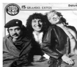
Three SOULS in My Mind CDMX 1968

actos con expresiones musicales de enorme innovación y penetración en sonidos y coreografías que parecían salir de la locura grupal, la sociedad de hoy no entendería el surgimiento y la trascendencia en el tiempo de bandas rocanroleras como Three Souls in my Mind, Banda Bostik, El Haragán o Santa Sabina (esta última, liderada por una mujer).