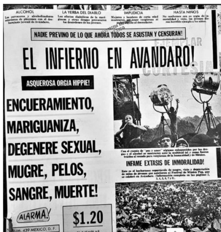
Fuente: La banda que fue censurada en pleno Festival de Avándaro y dio paso a la prohibición del rock en México - El Heraldo de México

Sin eventos como el Festival de Avándaro; sin influencias como las adoptadas en Woodstock y en otros