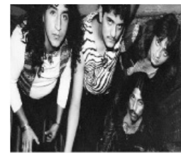
Banda Bostik Tlanepanlta Edomex. 1987