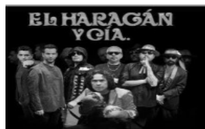
El Haragán y Cía. CDMX 1988