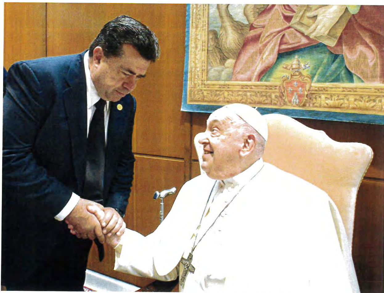
De izq. a der. Dip. Pedro Haces, Papa Francisco.

Antes de concluir nuestro encuentro, el Papa Francisco tuvo el gesto de darme su bendición. Sus palabras de aliento me llenaron de una renovada responsabilidad y motivación para seguir impulsando iniciativas que ayuden a construir una América Latina donde la migración no sea vista como un problema, sino como una oportunidad para el desarrollo y la integración.