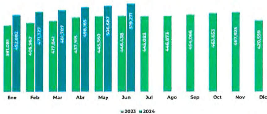
Gráfica 2. Comparativo mensual de saldos: ejercicio anterior vs ejercicio actual (millones de pesos)

En la reforma de 2001 a la Ley del Seguro Social, se constituyeron las reservas con la conformación vigente.