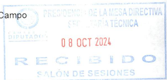
Margarita Ester Zavala Gómez del Campo Diputada Federal