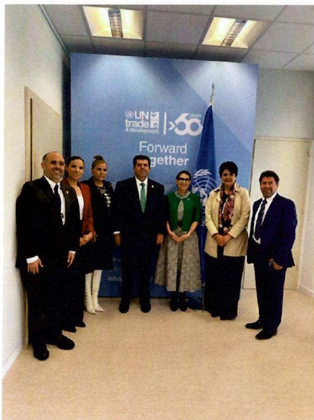
Delegación de México en la Asamblea de la UIP en Ginebra, 2024