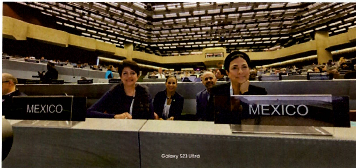
Delegación de México