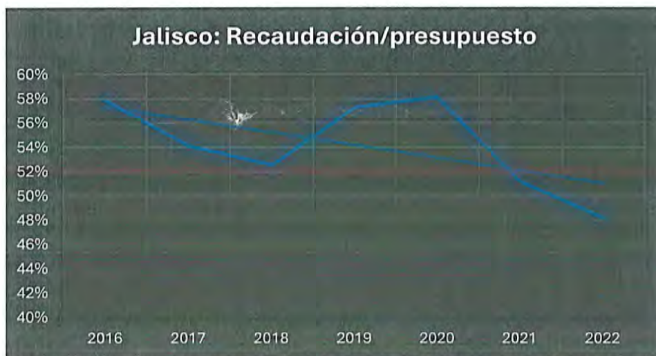
Figura B: Elaboración propia con datos del CEFP (Ej. Jalisco)

Bajo esta misma lógica, al analizar el crecimiento de las capacidades recaudatorias en el estado en cuanto al IVA, IEPS e ISR y contrastarlas con las participaciones y aportaciones federales recibidas es evidente como la asignación de recursos ha presentado una tendencia a la baja por lo menos del 2016 al 2022, evidenciando que la distribución del presupuesto federal no se ha ajustado al desarrollo de la capacidad recaudatoria de la entidad.