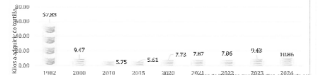
Kilos de Tortillas que se adquieren con un salario mínimo (1982, 2000, 2010, 2015, 2020-2023)

Fuente: Elaboración propia con datos del Sistema Nacional de Información e Investigación de Mercados (SNIIM). Secretaría de Economía, INEGI y del Centro de Análisis Multidisciplinario de la UNAM