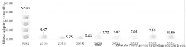
Kilos de Tortillas que se adquieren con un salario mínimo (1982, 2000, 2010, 2015, 2020-2023)

Fuente: Elaboración propia con datos del Sistema Nacional de Información e Integración de Mercados (SNIIM), Secretaría de Economía, INEGI y del Centro de Análisis Multidisciplinario de la UNAM