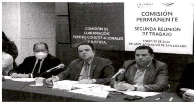
Reunión de la Segunda Comisión de Trabajo

tienen a donde acudir para pedir justicia en caso de que consideren vulnerados sus derechos.