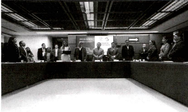
Reunión de Instalación de la Comisión de Trabajo

Primer Receso del Tercer año de Ejercicio de la LXV Legislatura "2024 Año De Felipe Carrillo Puerto, Benemérito del Proletariado, Revolucionario y Defensor del Mayab"