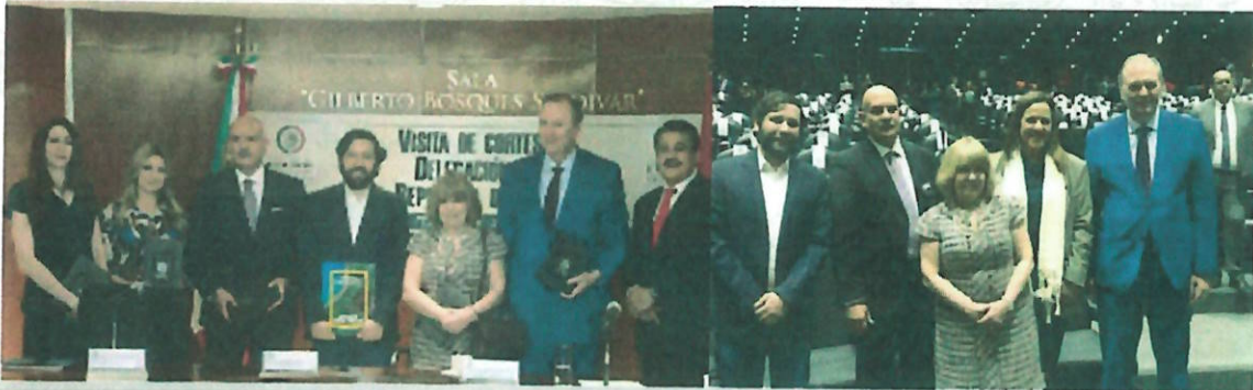
Fotos de la Reunión de Trabajo con integrantes de la comitiva enviada de la República de Croacia