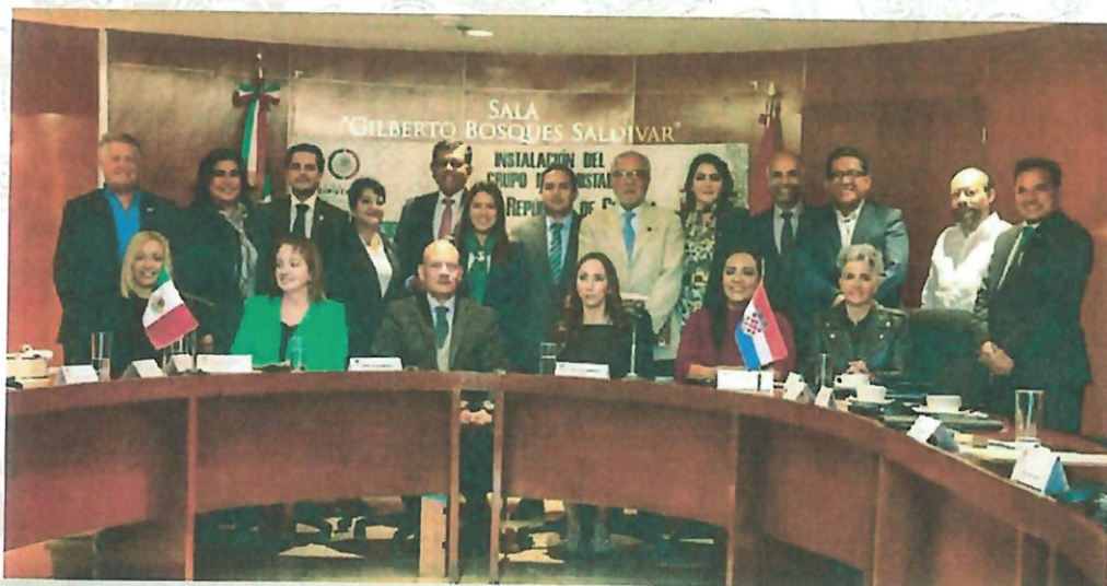
Foto Oficial de la Instalación del Grupo de Amistad México-República de Croacia de la LXV Legislatura.