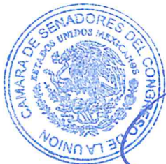
SEN. ANA LILIA RIVERA RIVERA Presidenta

SALÓN DE SESIONES DE LA HONORABLE CÁMARA DE SENADORES.- Ciudad de México, a 17 de abril de 2024