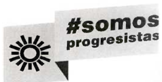
Olga Luz Espinosa Morales DIPUTADA FEDERAL