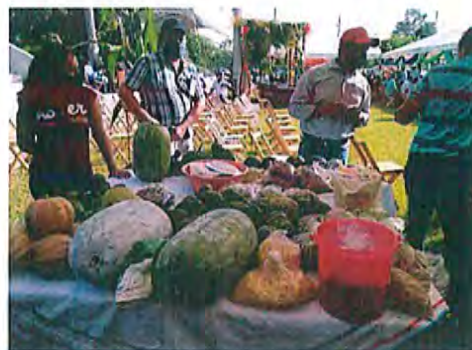
Imagen 3. Frutas, tubérculos y verduras que distribuyen en los tianguis.

En los tianguis se ofrecen 3,502 productos diversos, dentro de las verduras se encuentran la calabaza, yuca, pepino, chile, cebollín, chayote, quelites y cilantro. Dentro de los granos y cereales se encuentran el maíz, frijol, arroz y avena. De la variedad de frutas se comercializan limón, plátano, zapote, carambola, aguacate, papaya, manzana, durazno, pera, piña y sandía.