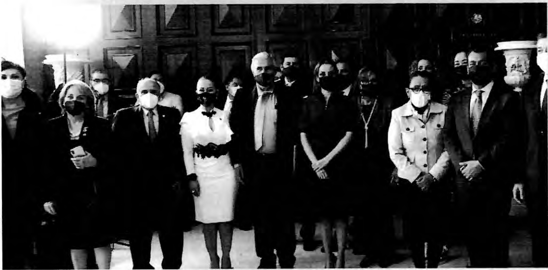
SENADORA POR MAYARIT