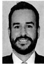
Dip. Basave Alanís Agustín Carlos (MC)

PRIMER INFORME SEMESTRAL DE ACTIVIDADES DEL PRIMER AÑO DE LA LXV LEGISLATURA, CORRESPONDIENTE AL PERIODO SEPTIEMBRE 2021-FEBRERO DE 2022.