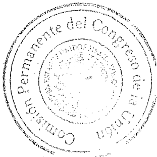
DIP. SERGIO CARLOS GUTIÉRREZ LUNA Secretario