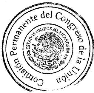
DIP. SERGIO CARLOS GUTIÉRREZ LUNA Secretario