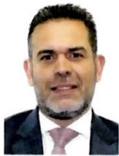
DIP. JORGE ARTURO ARGÜELLES VICTORERO