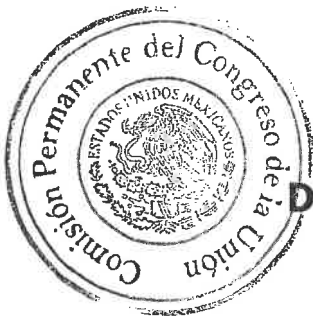
DIP. SERGIO CARLOS GUTIÉRREZ LUNA Secretario