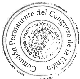
DIP. SERGIO CARLOS GUTIÉRREZ LUNA Secretario