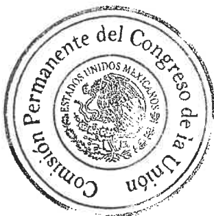
DIP. SERGIO CARLOS GUTIÉRREZ LUNA Secretario