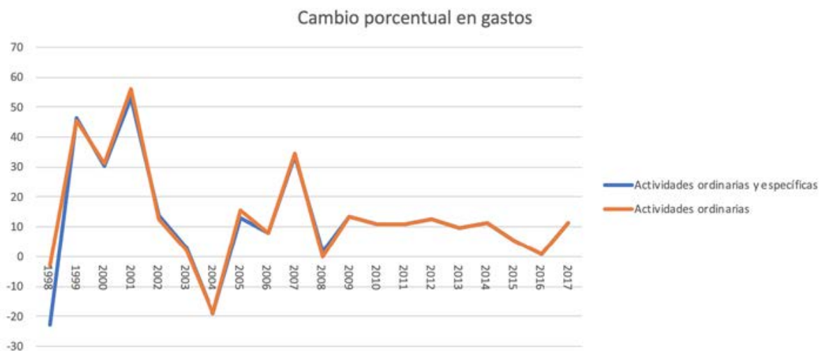
Gráfica 2: cambio porcentual en gasto de partidos 1997-2017

Fuente: INE. Gasto expresado en pesos de 2017.