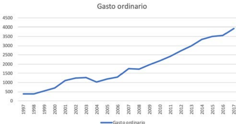
Gráfica 1: gasto para actividades ordinarias de partidos 1997-2017

Fuente: INE. Gasto expresado en pesos de 2017.