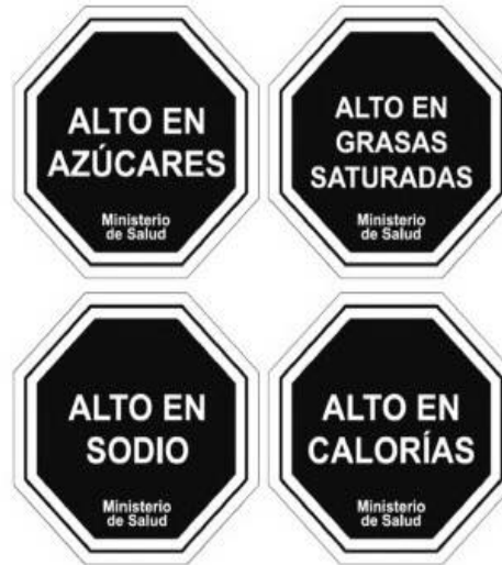
Diagrama N° 1

de fondo color negro y borde blanco, y en su interior el texto "ALTO EN", seguido de: "GRASAS SATURADAS", "SODIO", "AZÚCARES" o "CALORÍAS", como ejemplo: