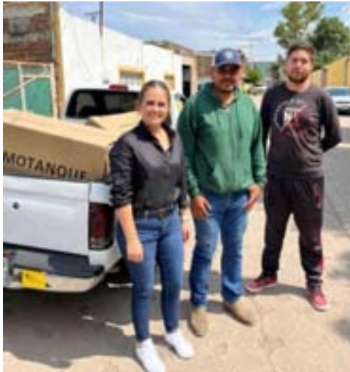
Entrega de calentadores solares a bajo costo, a los amigos de la mesa de Amula, en el municipio de Zapotlán del Rey.