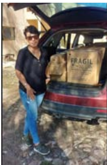
Apoyo en entrega de productos a bajo costo en el municipio de Ayotlán.