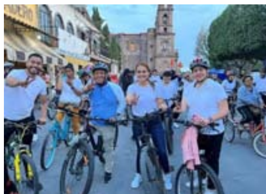
Clausura de los cursos de verano con los Directivos de La Biblioteca Jesús Reyes Heróles, en el municipio de Tototlán.