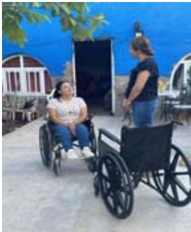
Entrega de sillas de ruedas en diferentes comunidades.