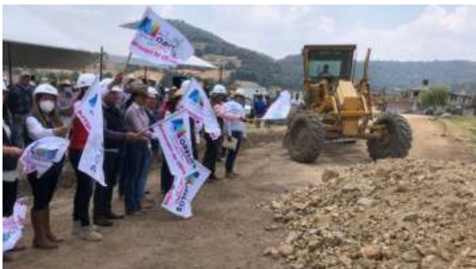
Revestimiento de Camino Saca Cosecha, Morelos.