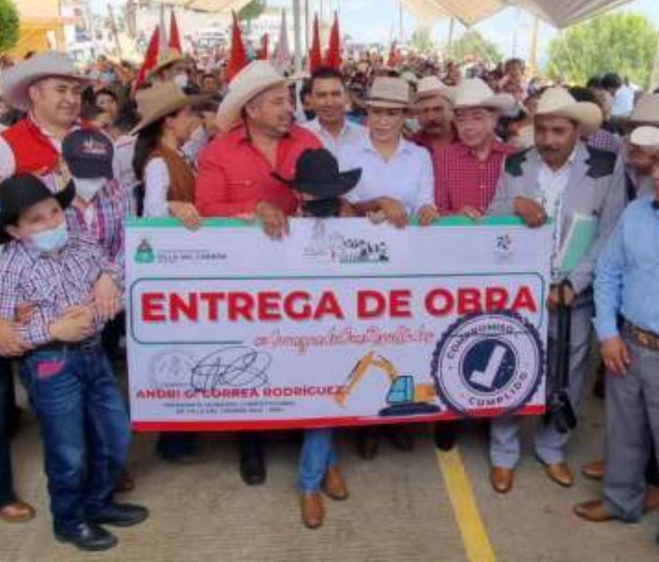
Pavimentación de Calles, Villa del Carbón.