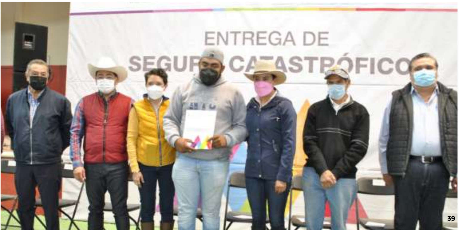
Entrega de Seguro Agrícola Catastrófico, Polotitlán.