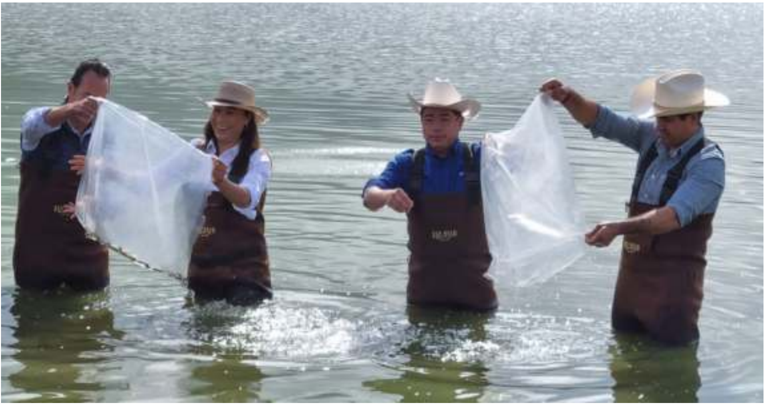
Siembra de Cría de Carpa en la Presa San Fernando, Temascalcingo.