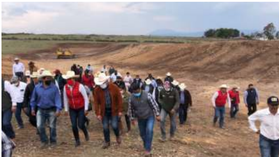
Entrega de Bordos, Jilotepec.