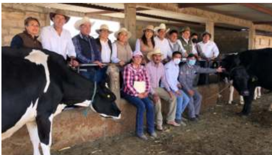
Campaña de Vacunación a Ganado Bovino, Ovino y Caprino, Aculco.