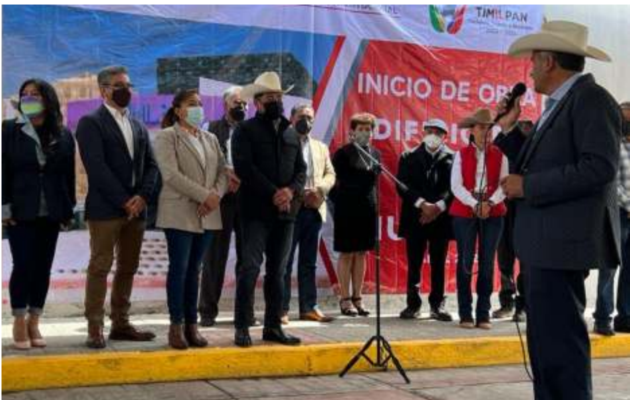
Colocación de la primera piedra del Sistema DIF de Timilpan.