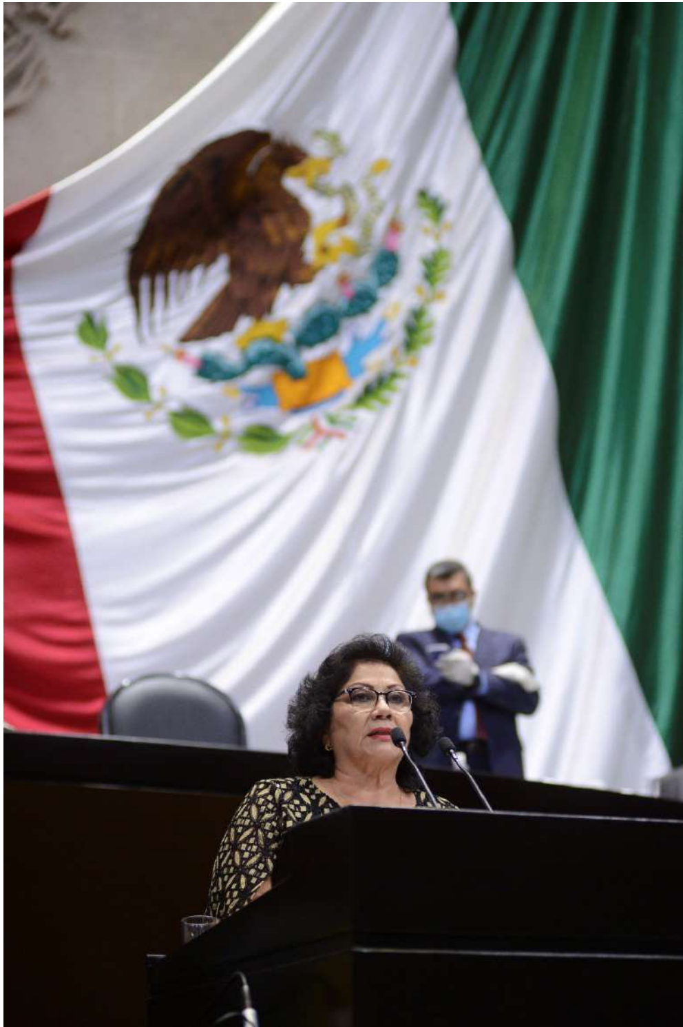
Diputada Federal por el Distrito Electoral 02, Hidalgo