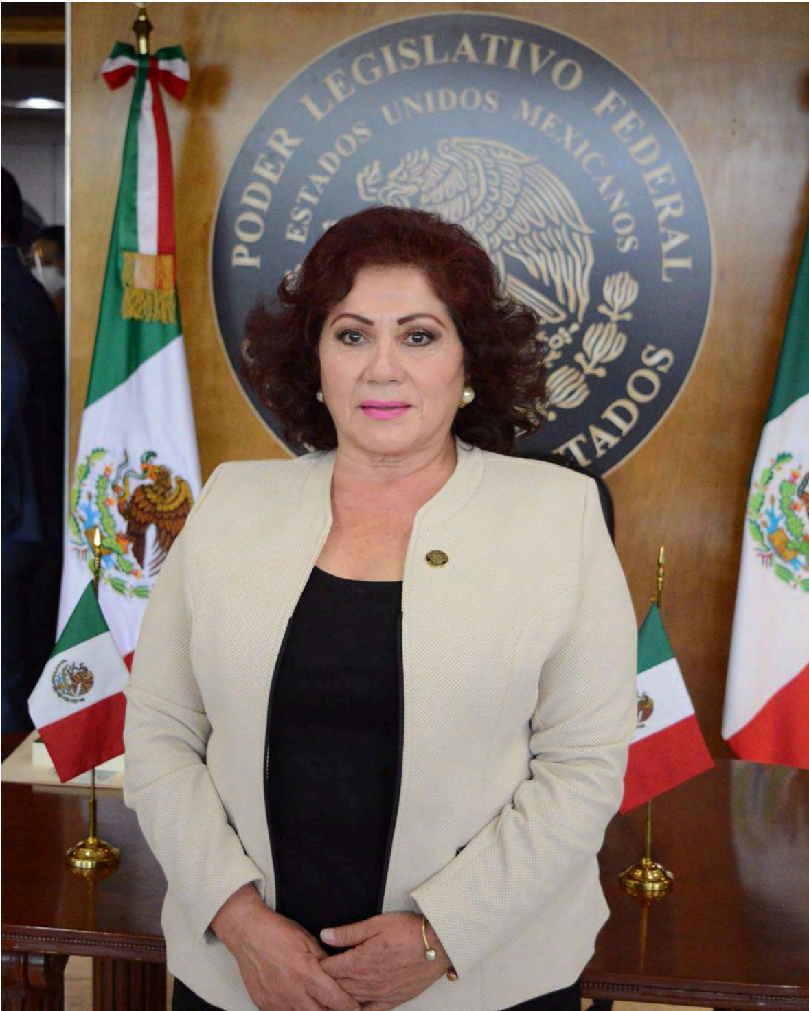
Diputada Federal por el Distrito Electoral 02, Hidalgo