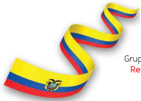
Grupo de Amistad República del Ecuador