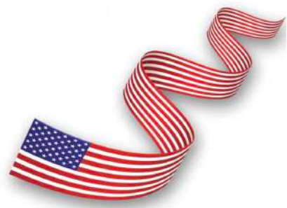
Grupo de Amistad Estados Unidos de América