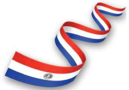
Grupo de Amistad República del Paraguay