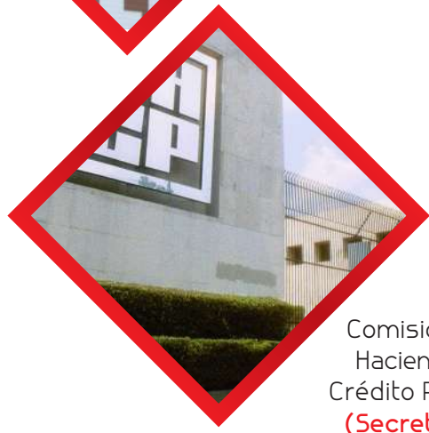
Comisión de Hacienda y Crédito Público (Secretario)