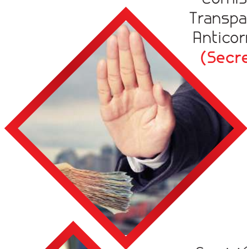
Comisión de Transparencia y Anticorrupción (Secretario)