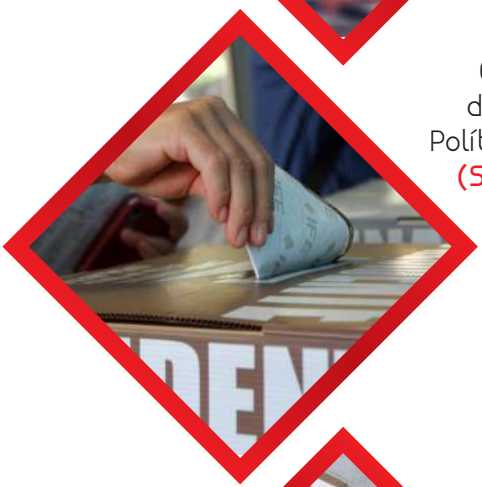
Comisión de Reforma Política-Electoral (Secretario)