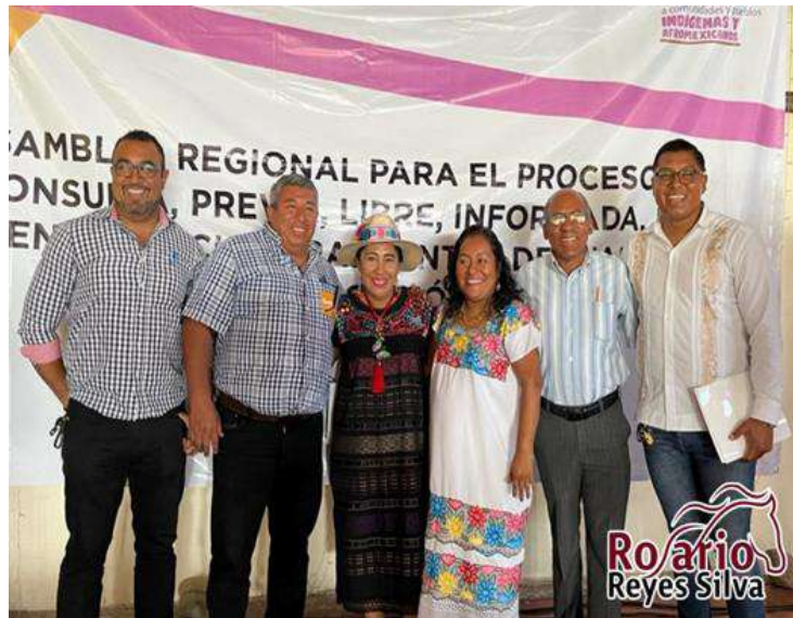
24 de marzo de 2023. Clausura de la "Asamblea Regional en Guerrero para la Consulta Previa, Libre, Informada, de Buena Fé y Culturalmente Adecuada en Materia de Educación Indígena.