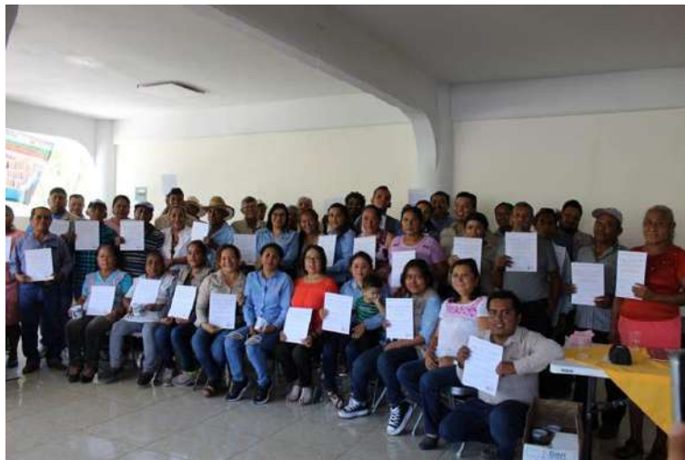
07 de julio del 2023. Se realizó el Encuentro Nacional de Productores en Transición Agroecológica. Reconocimiento de Saberes Campesinos y Certificación de Técnicos, en el Complejo Cultural Los Pinos.