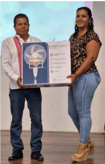
Se entregaron 25 regalos para madres de familia de la escuela Telesecundaria David Alfaro Siqueiros, quienes fueron festejadas por el personal docente.