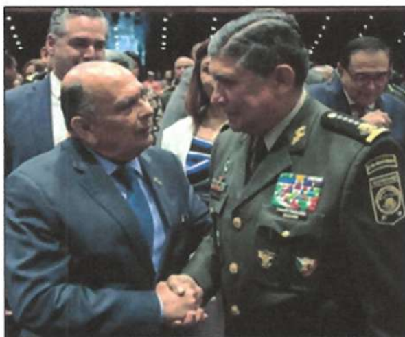
Ilustración 7. En el 110 Aniversario del Ejército Mexicano, CDMX.