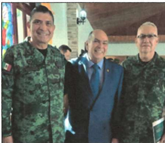
Ilustración 5. Campo Militar No. 1, CDMX.