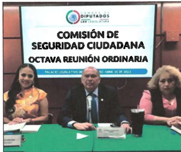
Ilustración 13. Última Sesión Ordinaria de la Comisión de Seguridad Ciudadana, en la Cámara de Diputados.

13. Con fecha del 25 de abril de 2023, participé en la última Sesión Ordinaria de la Comisión de Seguridad Ciudadana, en la Cámara de Diputados.