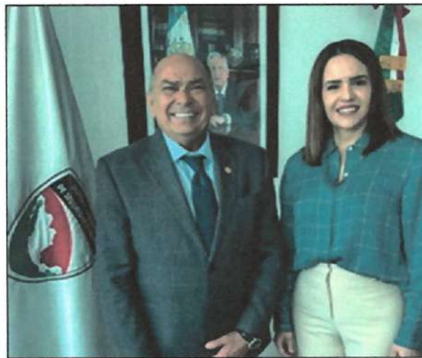
Ilustración 9. Sistema Nacional de Seguridad Pública, CDMX.