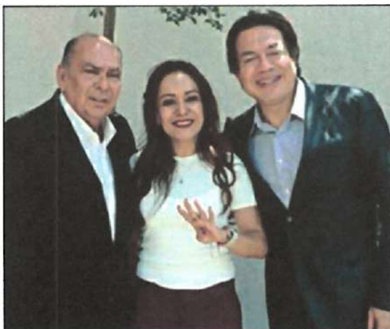
Ilustración 10. Reunión de Trabajo del Partido MORENA.