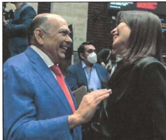
Ilustración 3. Inicio de Segundo Periodo Ordinario.