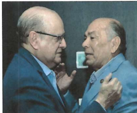
Ilustración 15. Visita a las instalaciones del Sindicato Nacional de Trabajadores del Seguro Social.