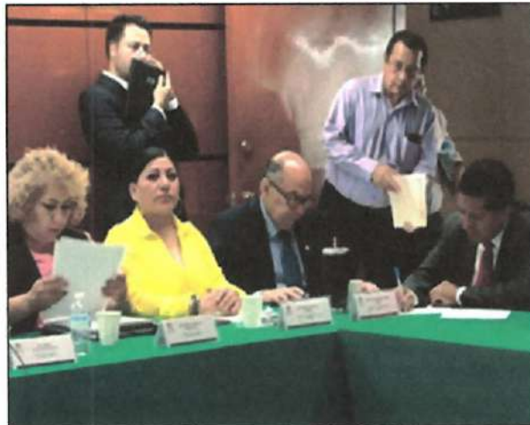
Ilustración 19. Reunión de la Comisión de Seguridad Ciudadana.

19. Con fecha del 30 de agosto de 2023, participé en la reunión de la Comisión de Seguridad Ciudadana, para cumplir con mi trabajo legislativo en la materia.