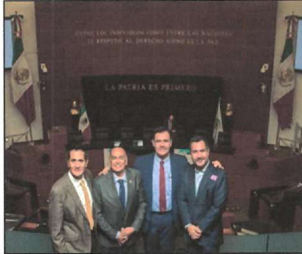
Ilustración 8. Conferencia magistral "Pandemia y vacunas, lecciones aprendidas".