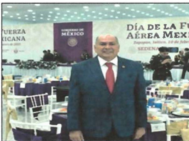
Ilustración 4. “Día de la Fuerza Aérea Mexicana”, Zapopan Jalisco.