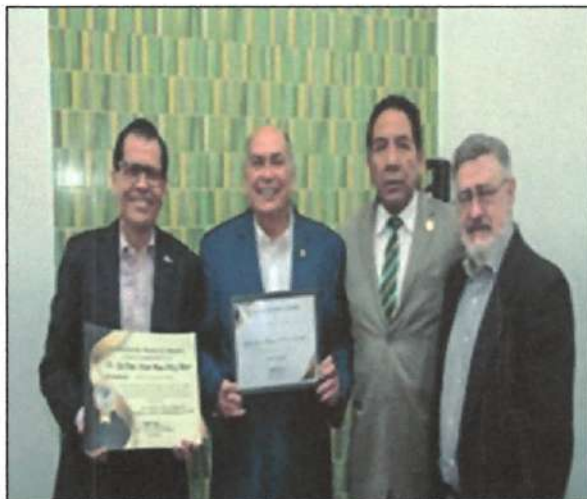
Ilustración 6. Organización Mundial de Abogados, CDMX.