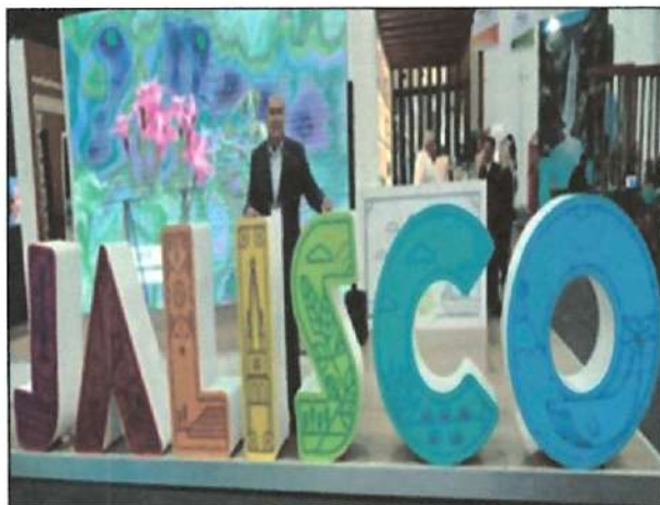
Ilustración 11. Tianguis Turístico, CDMX.