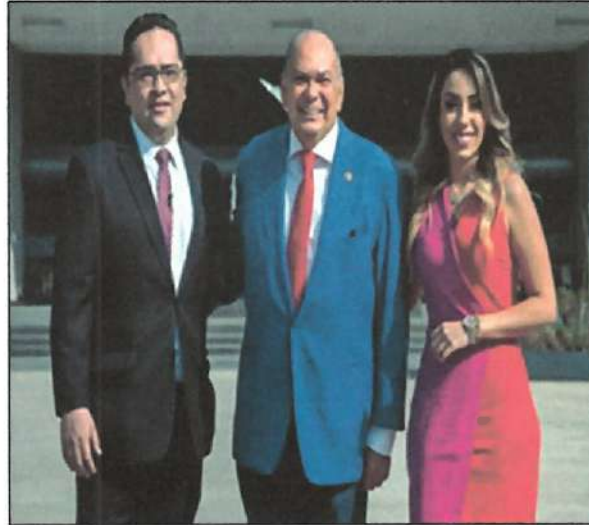
Ilustración 2. Entrevista para el Canal del Congreso.