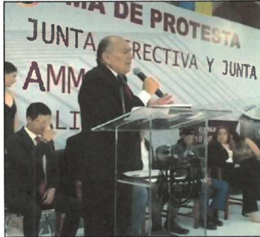
Ilustración 14. En la toma de protesta de la Junta Directiva de AMMAC (Asociación Mexicana de Municipios de México).