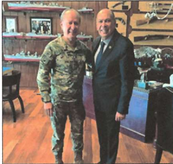
Ilustración 16. Reunión en las instalaciones de la Secretaría de Marina.

16. Con fecha del 21 de junio de 2023, tuve una reunión en las instalaciones de la Secretaría de Marina, trabajando en favor de Jalisco.