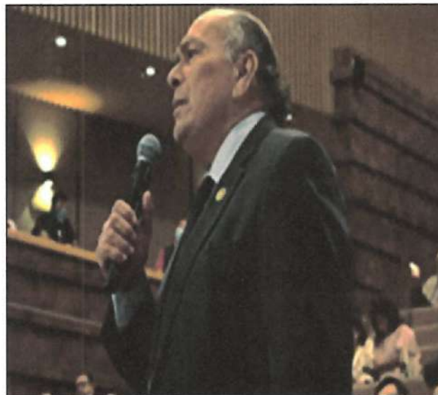
Ilustración 1. 4a Reunión Plenaria del Grupo Parlamentario MORENA.