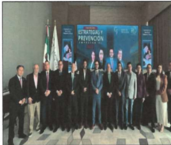
Ilustración 17. Foro Nacional de Estrategias y Prevención Empresarial.

17. Con fecha del 03 de julio de 2023, asistí al Foro Nacional de Estrategias y Prevención Empresarial, para externar mi apoyo en favor de la creación de nuevas empresas en Jalisco.