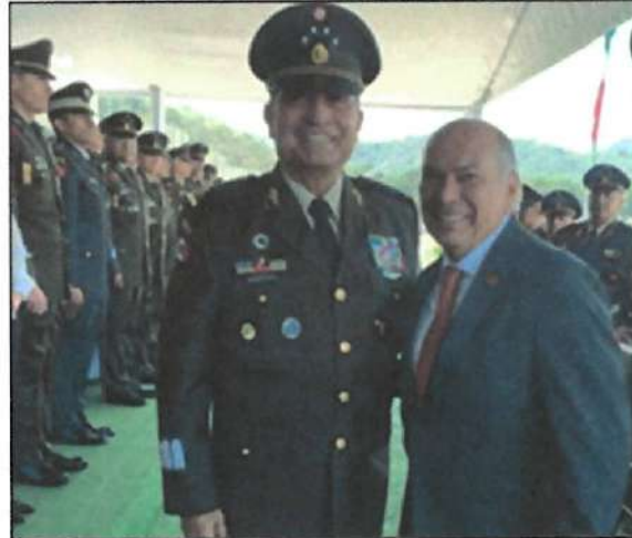
Ilustración 20. Visita al H. Colegio Militar.

20. El mismo día, atendí la invitación al evento realizado en el H. Colegio Militar, donde fortalecí vínculos con sus representantes, al igual que di el reconocimiento a sus labores en favor de la seguridad del país.