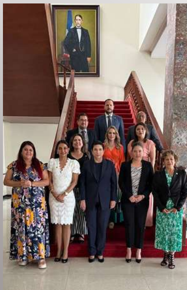
Reunión Interparlamentaria en el País de República Dominicana