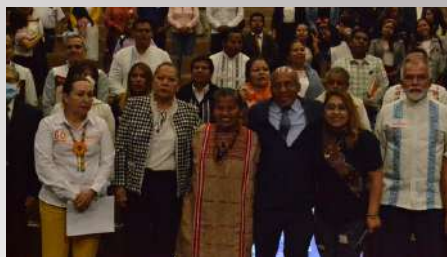
Foros de consulta

En este año, integrantes del grupo de lucha afrodescendiente, realizamos un evento en el marco conmemorativo del día mundial de África, logramos mantener un panel de trabajo donde interactuamos y presentamos solución a diversas problemáticas que fueron expresando personas invitadas con afrodescendencia, continuamos en constante trabajo para dar solución a lo que con confianza, nos expresaron las y los invitados.