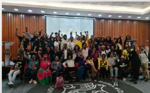
Cumbre por la Paz, CNDH

En este año, integrantes del grupo de lucha afrodescendiente, realizamos un evento en el marco conmemorativo del día mundial de África, logramos mantener un panel de trabajo donde interactuamos y presentamos solución a diversas problemáticas que fueron expresando personas invitadas con afrodescendencia, continuamos en constante trabajo para dar solución a lo que con confianza, nos expresaron las y los invitados.