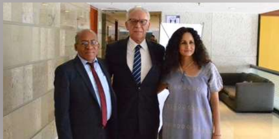
Día Mundial de África

En la Cumbre por la Paz organizada por miembros del movimiento internacional Black Lives Matter, tuve la oportunidad de charlar con comunidades afrodescendientes que han sufrido la injusticia racial. Intercambiamos ideas y señalamos los puntos claves de la lucha contra la agresión a personas con descendencia africana, que ha sido una triste realidad a lo largo de la historia y sigue presente en la actualidad.