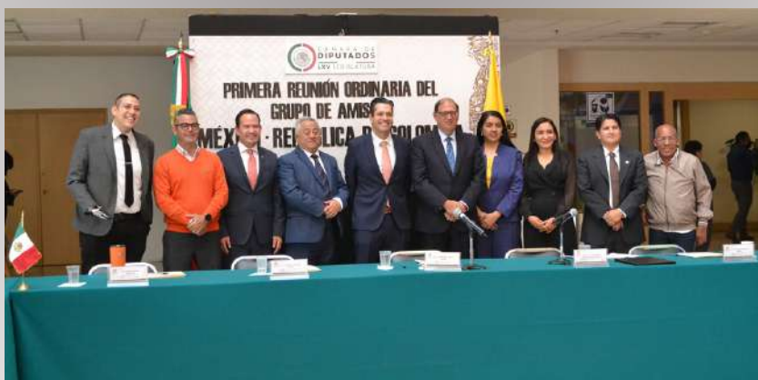
Primera Reunión Ordinaria del Grupo de Amistad con la República de Colombia