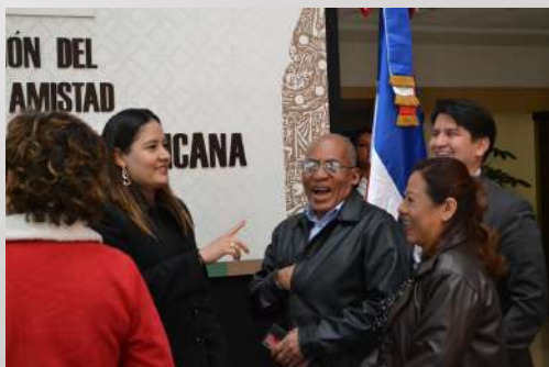
Instalación del Grupo de Amistad con República Dominicana