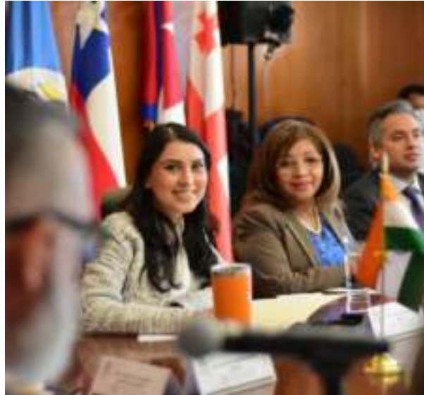
GRUPO DE AMISTAD CON PAKISTÁN