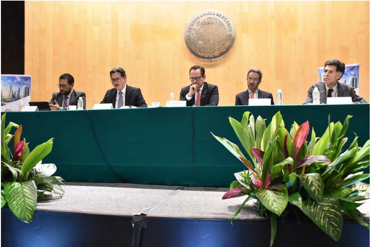
Foto: Panel realizado en el marco de la Jornada Nacional de Infraestructura Transformadora, organizado por la Comisión de Infraestructura de la Cámara de Diputados.