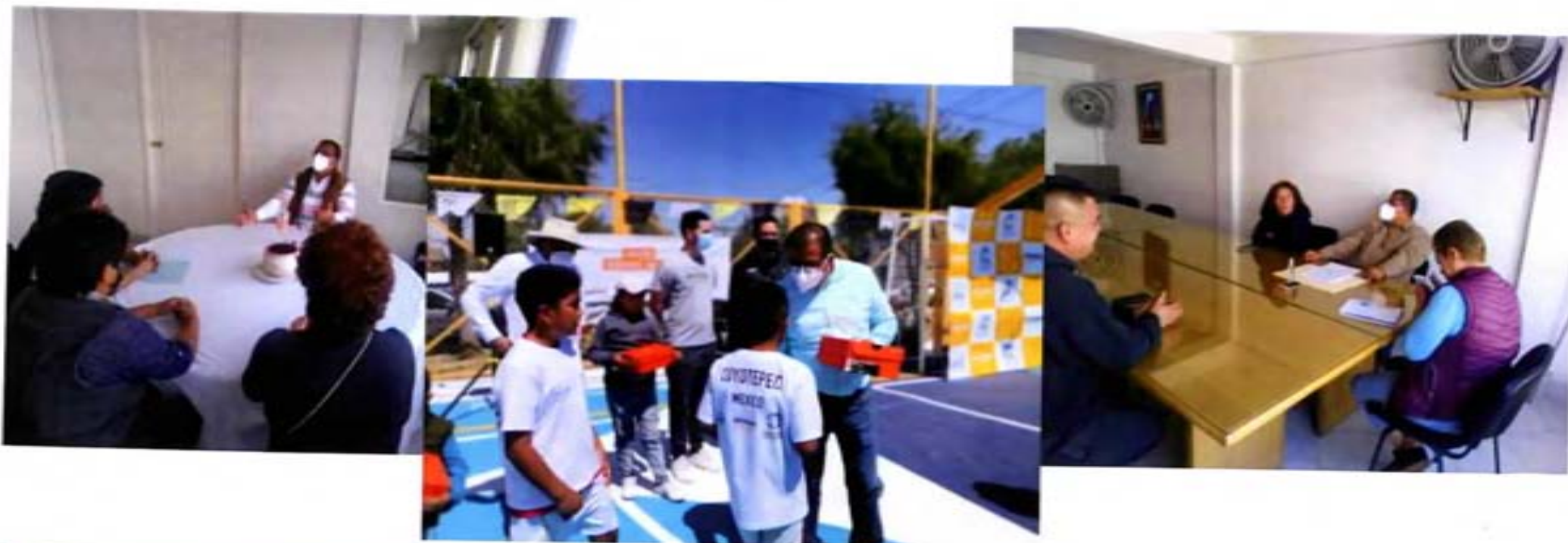
Luis Enrique Martínez Ventura Diputado Federal | Distrito 32

En este primer año legislativos, y a pesar de la pandemia provocada por COVID-19, se atendieron a más de 600 ciudadanos en las oficinas de la Diputación Federal del Distrito 32 y en la oficina de esta representación en el Palacio Legislativo de San Lázaro, sosteniendo diversas reuniones y encuentros con sectores sociales, económicos y políticos; con organizaciones no gubernamentales quienes atienden temas relativos al medio ambiente, a capacidades diferentes, grupos vulnerables, con padres de familia, quienes expresaron sugerencias, solicitudes y planteamientos como el mejoramiento de servicios públicos en su correspondiente comunidad, gestión de programas sociales, mayor presupuesto para el Distrito, el recordatorio de que no nos olvidemos de los compromisos de campaña entre gran diversidad de temas.