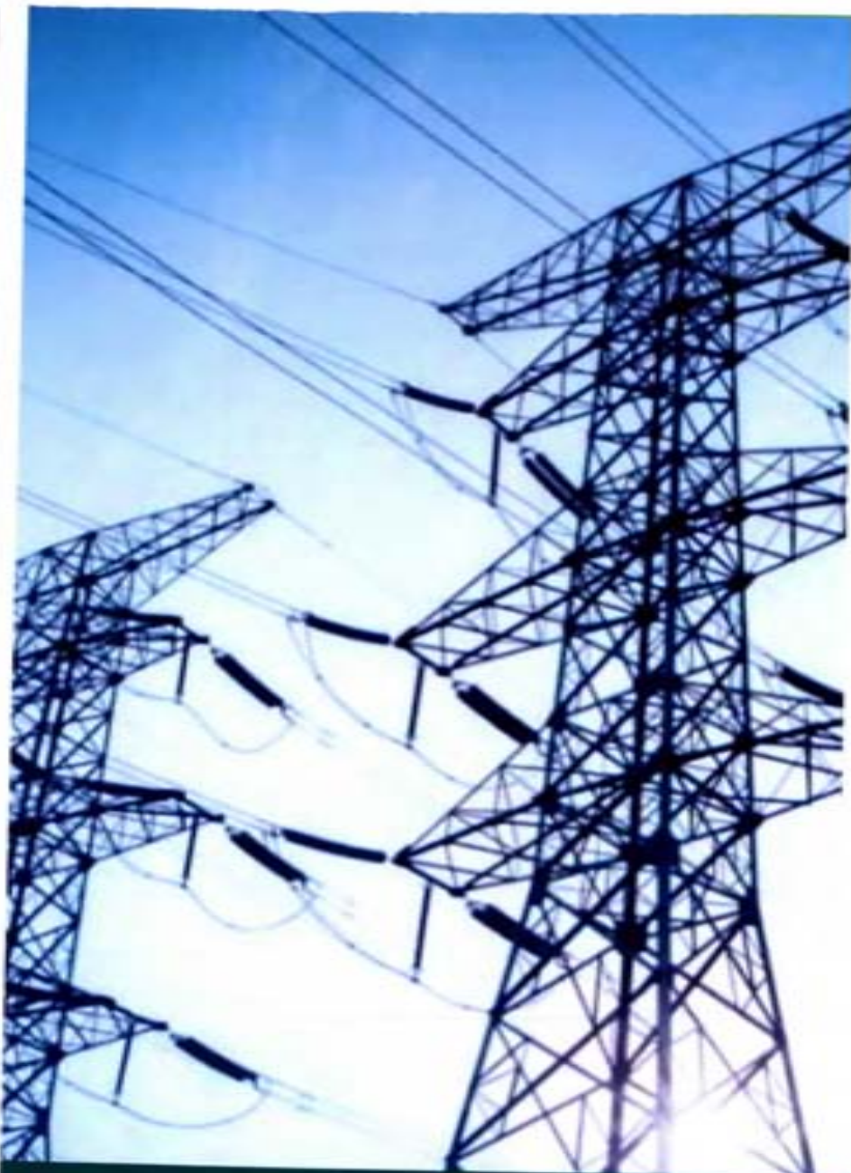
Luis Enrique Martínez Ventura Diputado Federal | Distrito 32

Se discutió el dictamen del proyecto de decreto que reforma los artículos 25, 27 y 28 de la Constitución Política de los Estados Unidos Mexicanos, en materia energética. Esta iniciativa de reforma tenía como fin establecer que el estado preservará la seguridad y autosuficiencia energética, y el abastecimiento continuo de energía eléctrica a toda la población de manera soberana , otorgando facultades al Gobierno Federal para establecer reservas nacionales sobre bienes en los que el dominio de la Nación es inalienable e imprescriptible. Así mismo, se pretendía incorporar el litio y demás minerales estratégicos para la Transición Energética, mismos que no podrán ser concesionados a empresas privadas y extranjeras , fijando que estas acciones corresponden exclusivamente a la Nación. También esta reforma establecía promover acciones hacia la Transición Energética y el empleo sustentable de todas las fuentes de energía.