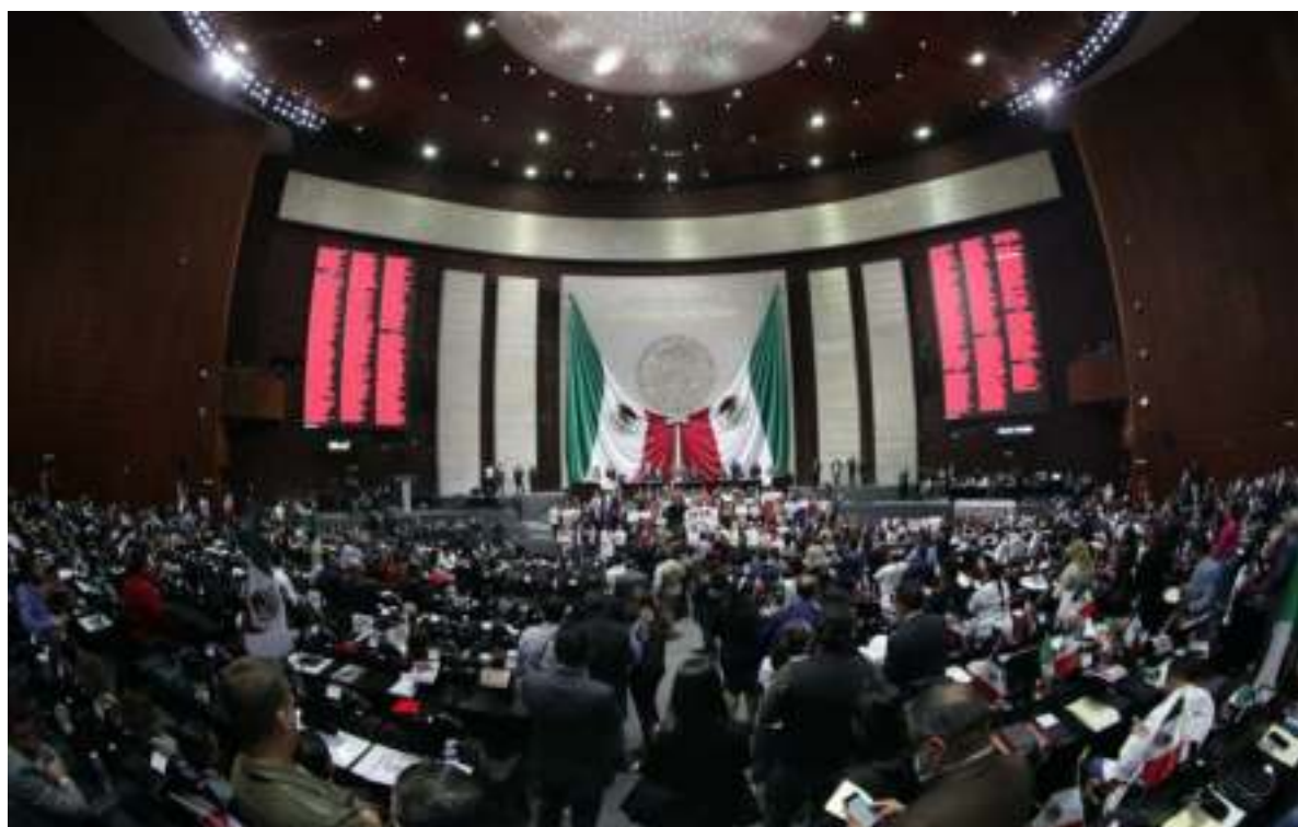
Salón del Pleno de la Honorable Cámara de Diputados

De igual forma, durante el desarrollo de las actividades en comisiones, asistí a todas las sesiones, cumpliendo con cabalidad la responsabilidad encomendada por la ciudadanía.