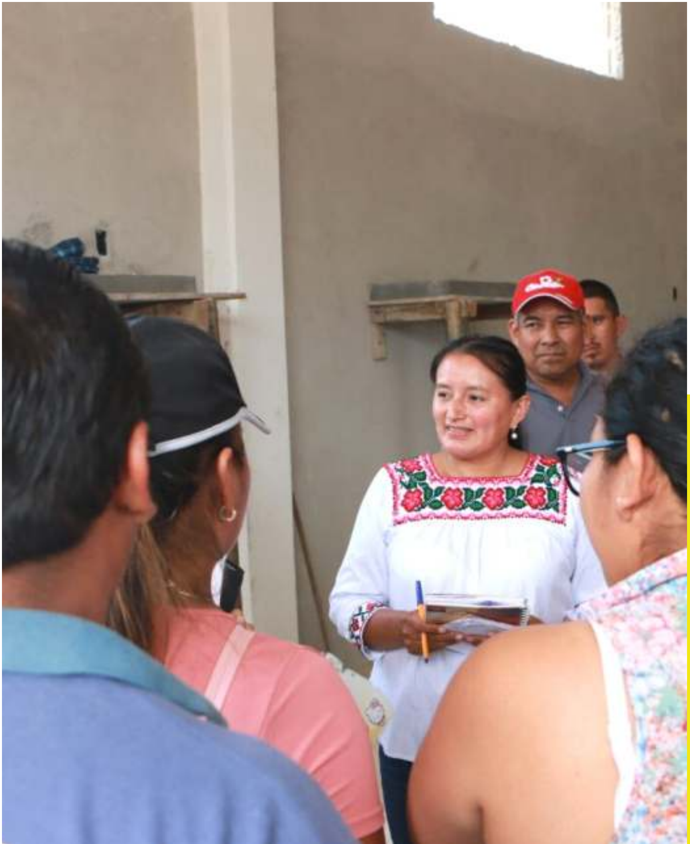
Reunión de trabajo con vecinas y vecinos del municipio de Hueytmalco