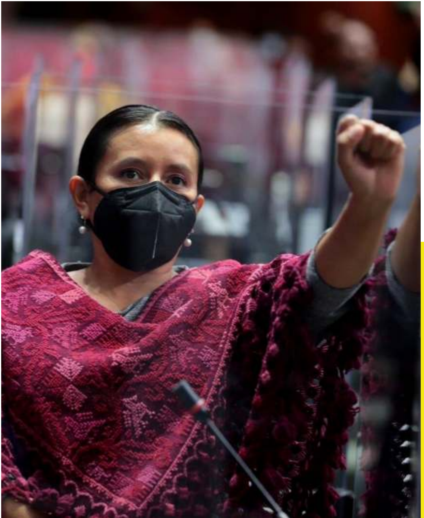
Primer periodo de Sesiones Ordinarias en la Honorable Cámara de Diputados.